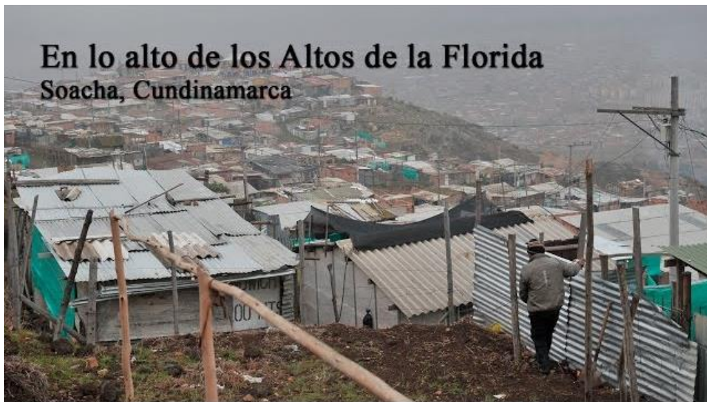
Ilustración 1:

Al mismo tiempo, las viviendas son construcciones hechas con materiales como lámina, madera, ladrillo y teja de Eternit, y hoy llegan casi hasta la cima del cerro y justamente por estar construidas en la loma y sin estudios previos, son construcciones con una probabilidad alta de derrumbe. Por otro lado las carreteras o vías de acceso también están en pésimas condiciones, lo que hace que el acceso a los barrios se dificulte o empeoren sus condiciones en periodos de lluvias, pues al estar las carreteras sin pavimentar se convierten en lodazales.