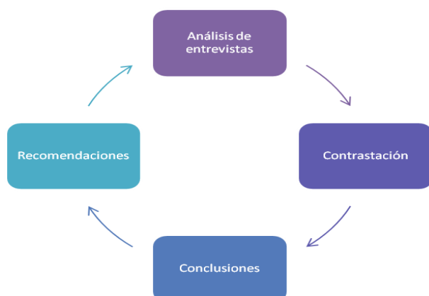
Figura 3. Tercera Fase. Consolidación de los datos