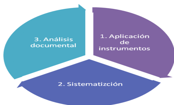
Figura 2. Segunda Fase. Aplicación de instrumentos y análisis de la información.

El momento dos de la investigación conllevó tres pasos: el primero, la aplicación de los instrumentos, entonces se ejecutaron las entrevistas a los jóvenes inmersos en el programa y los funcionarios del Instituto Colombiano de Bienestar Familiar, Regional Tolima. El segundo paso se ejecutó simultáneamente con el análisis documental y el tercero, conllevó la sistematización de las entrevistas, como se detalla en la siguiente ilustración.