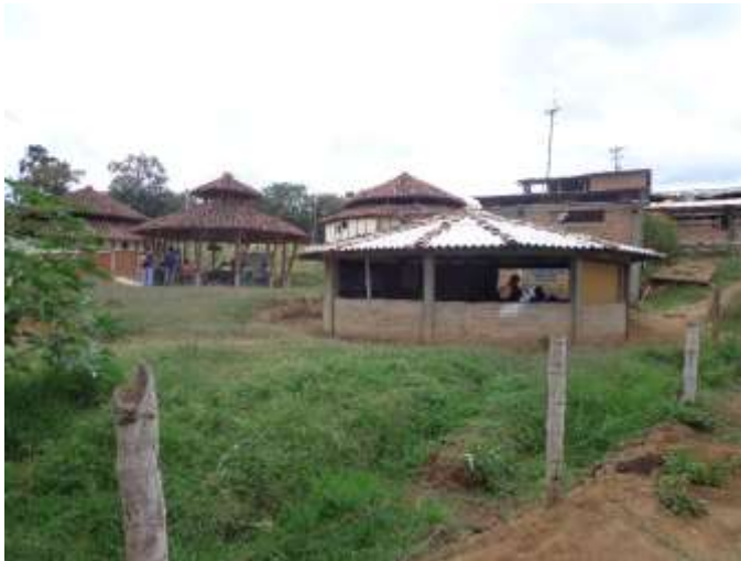
Fotografía N °1. Salones cuarto y quinto Octubre 2015

Nos centraremos en los salones circulares en donde los estudiantes se ubican de manera horizontal o en mesa redonda permitiendo al maestro tener una observación adecuada de lo que hacen cada uno de los estudiantes y atendiendo adecuadamente sus inquietudes; así mismo en la observación de estas dinámicas de las clases se ven directamente relacionadas con el entorno que las rodea, ya que no se intenta romper o alejar a los niños de este, sino que complementarlo, por ello en cada una de sus clases constantemente se encuentran en contacto con el entorno que los rodea.