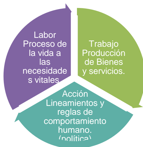
Figura1 Elaboración propia: Libro "la condición humana". Hannah Arendt. (Arent, 2009)