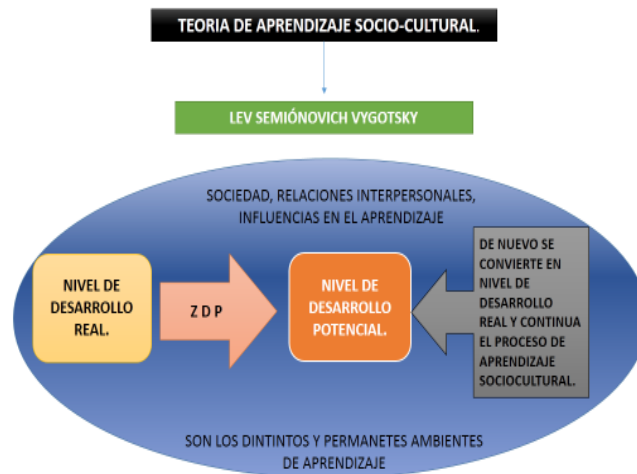
Figura 2. Teoría socio-cultural de Aprendizaje. Autora del PCP.

Teoría Socio-Cultural de Lev Vygotsky, manifiesta la importancia de las relaciones inter-personales y la influencia de los distintos núcleos o ambientes donde se presentan dichas relaciones, en cada uno de los procesos de aprendizaje de las personas a lo largo de su vida.