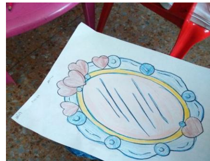
Ilustración 3-Que ves cuando te ves

Como segundo momento la maestra en formación proyecta fotos de su infancia, resaltando los aspectos físicos que menos le gustan, señalando sus complejos de cuando era niña, cada foto será analizada con el grupo de niñas de Casa Ángela. De esta manera se resalta que los seres humanos tienen un tiempo para crecer y cambiar, resaltando que los complejos causados por los “defectos” físicos” también