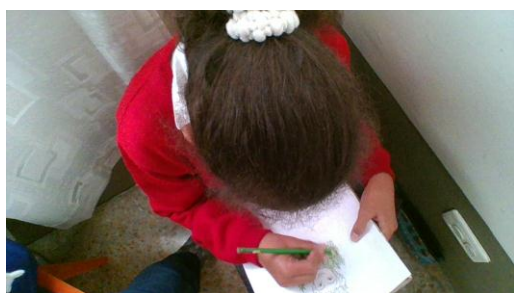
Ilustración 2-Cartas a Frida

A continuación, se hace la presentación biográfica de Frida Kahlo, con una imagen de ella, se les pregunta a las niñas si la conocen, la han visto o saben quién es, luego se hace énfasis en su lucha social como mujer, recalando que a pesar del sufrimiento debido a su accidente, mediante el arte se ratificó como una de las mejores artistas en la historia. Esto con