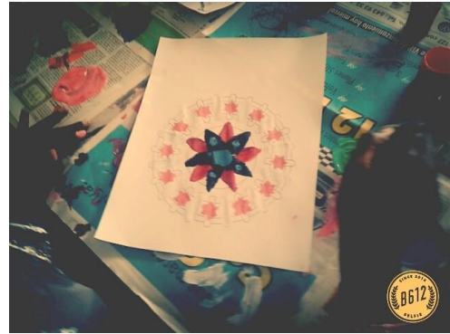
Ilustración 1-Los Mándalas, la poesía y el arte.

que sentimos porque se es catalogado como débil. Durante la lectura de la poesía, las niñas identifican la tristeza como un sentimiento común del ser humano, pero que si se acumula puede hacer daño, por lo cual están de acuerdo en encontrar formas de exteriorizarlo, como en esta ocasión mediante el arte.