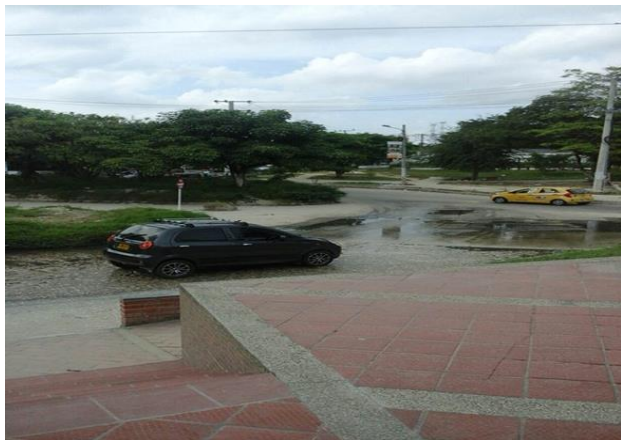
Figura 4. Estado actual de la Urbanización la Arboleda cuando cesa la lluvia, sin erosiones muy abruptas, 2014.