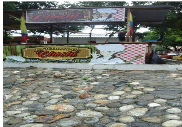
Figura 5. Negocio informal “Donde Chechi”, impactos económicos en los habitantes aledaños al anterior cauce del arroyo el Salado.

Además, de esta nueva oferta de actividades económicas en dicha urbanización, otro avance fue que los habitantes más cercanos al curso del pasado arroyo colocaron locales de comida rápida en sus hogares para ayudar en su economía familiar de subsistencia (Ver figura 5).