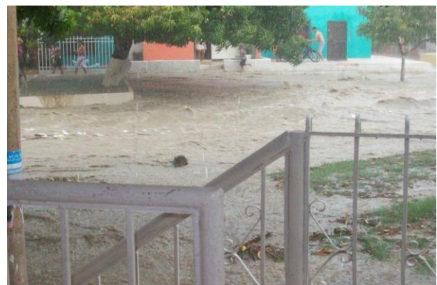
Figura 3. Urbanización la Arboleda antes de la canalización del Salado. 2010.

Además, por esta desviación en las afueras de la Urbanización, se construyó un puente con una rotonda para que los vehículos pudieran llegar al centro comercial Gran Plaza del Sol, sin ningún problema y salir de inmediato, se transformó el entorno físico, el cual hizo a la Urbanización la Arboleda un escenario favorable de inversión, es decir, económicamente se valorizó.