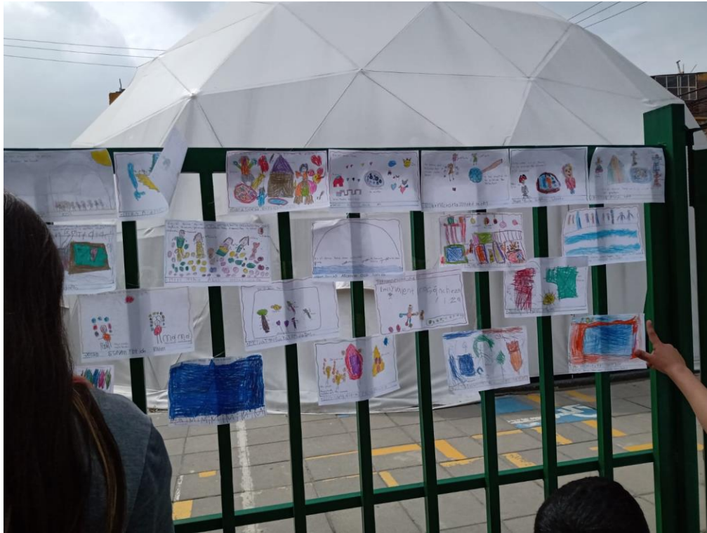
figura 14 Imaginario de las y los niños de primaria sobre lo que hay dentro del Domo geodésico

Diferentes formas de visualizar el mundo, las percepciones y los imaginarios, permiten que las niñas y niños puedan navegar en la creatividad, posibilitando diferentes formas de ser, estar y habitar.