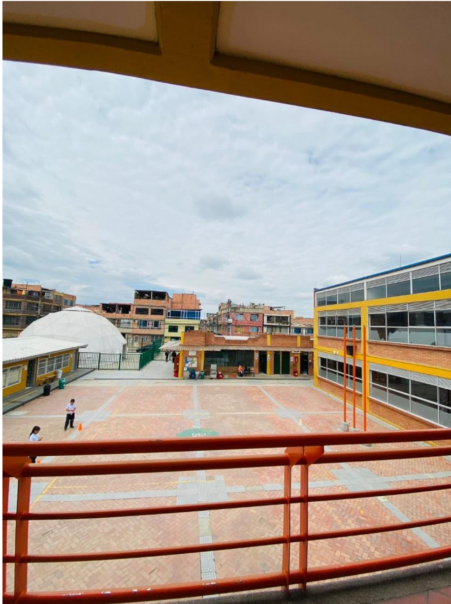
figura 12 Estructura externa del Domo geodésico

Se plantea la estructura de un domo geodésico siendo una estructura en forma de media esfera (estructura la cual puede ser creada con materiales como acero, aluminio o madera) que representa una concepción diferente a la estructura cuadrículada y esquemática de la escuela, en el círculo se evidencia la comunidad y la unión ya que es una figura que se conecta en sí misma, el domo geodésico como estructura circular es la representación simbólica de la “totalidad”