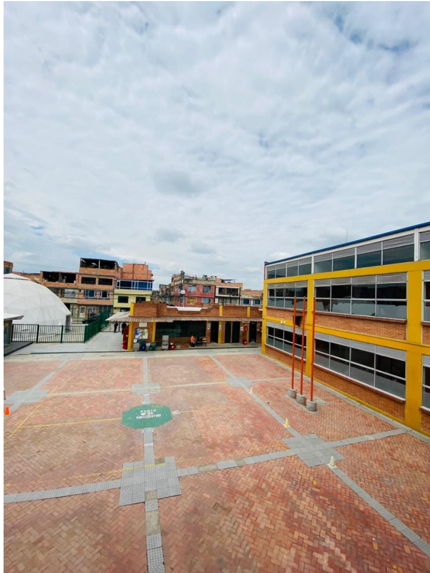
figura 6 Plaza de banderas IED El Porvenir y de eventos culturales

Las y los docentes que han trabajado desde los inicios de la “OMP”: IC han buscado que las diferentes muestras culturales que realizan las y los estudiantes al ser llevadas a cabo en la plaza de banderas, tiene una modificación completa, es decir, se transforma con telares, pancartas grandes, variedad de colores, generando una disposición del cuerpo distinta a la de estar rígido, en filas, sino por el contrario ubica al cuerpo en una disposición cómoda en la que se puede visualizar de manera amplia la actividad que se esté realizando