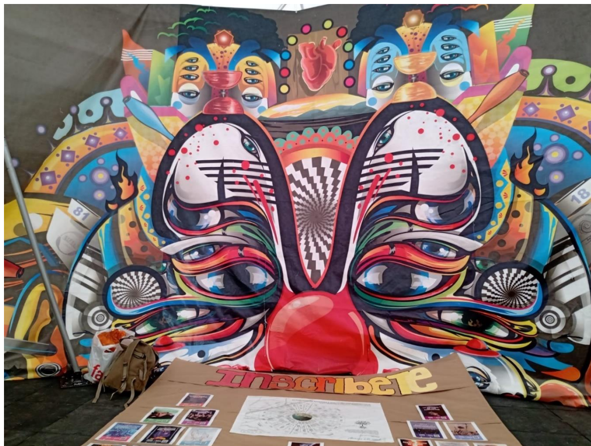
figura 11 Nuevos aprendizajes

Diversas formas de aprender, es un recuerdo vivo de como desde el ejercicio del colectivo, maestro y estudiantes, buscaban representar el sentido de la experiencia a través de distintas muestras culturales, agrupadas en las artes.