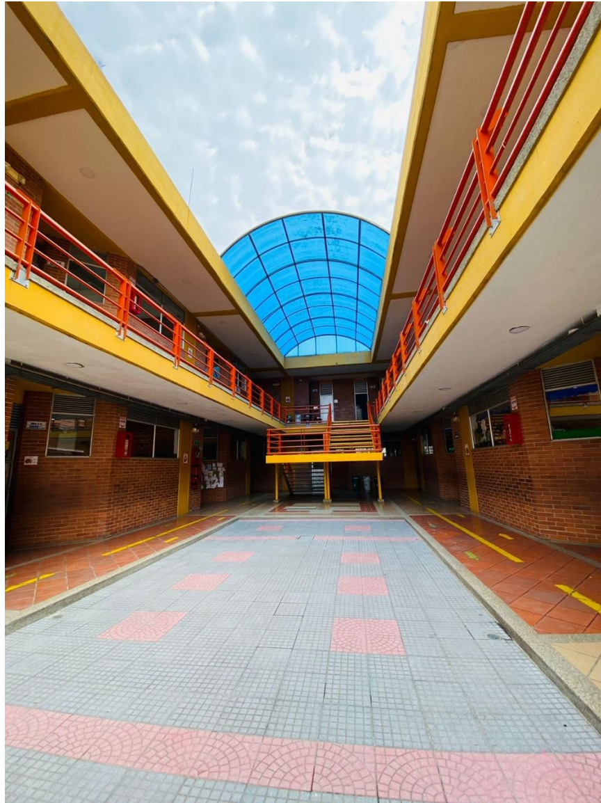
figura 4 Salones primer piso primaria, segundo piso secundaria

La IED El Porvenir, a pesar de su origen comunitario su arquitectura representa la de una escuela tradicional “cuadrículada” que se construye en la lógica de control y vigilancia, los salones mantienen la estética de pupitres en filas, tablero en frente, ventana en la puerta a modo de visor desde afuera hacia adentro, salones cuadrados, escritorio del docente en frente a los estudiantes que se moviliza entre las esquinas del salón.