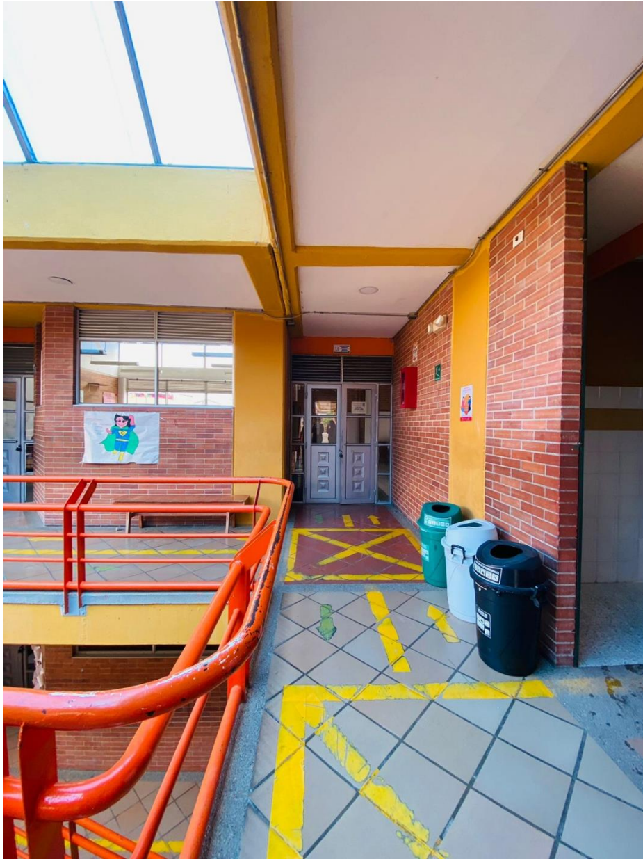
figura 5 Arquitectura normativa, pasillo hacia el salón de laboratorio

La arquitectura se muestra normativa y estricta para quienes la transita, me surge la reflexión por las marcaciones del piso son más cuadrículas dentro de la cuadrícula que las acompaña. Dicen los estudiantes que donde estaban las "x" en el suelo eran espacios donde no se podía estar porque interrumpían el paso, lo que me hace pensar que los pasillos en sí no eran muy amplios, obligando a los estudiantes a ubicarse en otros lugares.