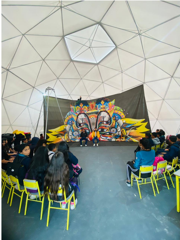
figura 13 Estructura interna del Domo geodésico

El domo geodésico (estructura blanca que se muestra en la fotografía), rompe con esa estructura física, cuadrículada y tradicional de la institución e incluso del barrio, pues suele ser llamativa por su color y forma, es inevitable cruzar la calle y no percibir tal estructura.