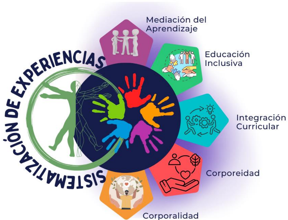
figura 9 Categorías