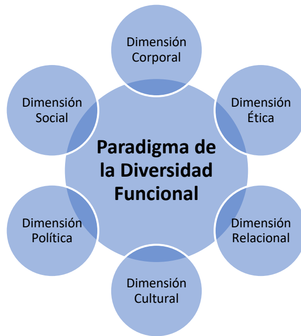
figura 8 Dimensiones del paradigma de la Diversidad Funcional

Fuente: Elaboración Propia Según Toboso, M (2021) la dimensión corporal, se entiende desde el reconocimiento propio del cuerpo y como este se va transformando a lo largo de la vida, es por ello que se define desde dos componentes : el primero corresponde al extensivo que se asocia a la experiencia que se tiene del cuerpo en relación con las otras personas que puede variar entre las personas y que constituyen lo que se denomina como el cuerpo social; el segundo componente corresponde al intensivo que representa la variabilidad de las formas de funcionamiento del cuerpo teniendo en cuenta las diferentes etapas del ciclo vital en donde los usos y las prácticas corporales son distintas y únicas ya que se dan de manera individual, reconociéndolas desde punto de vista de la diversidad.