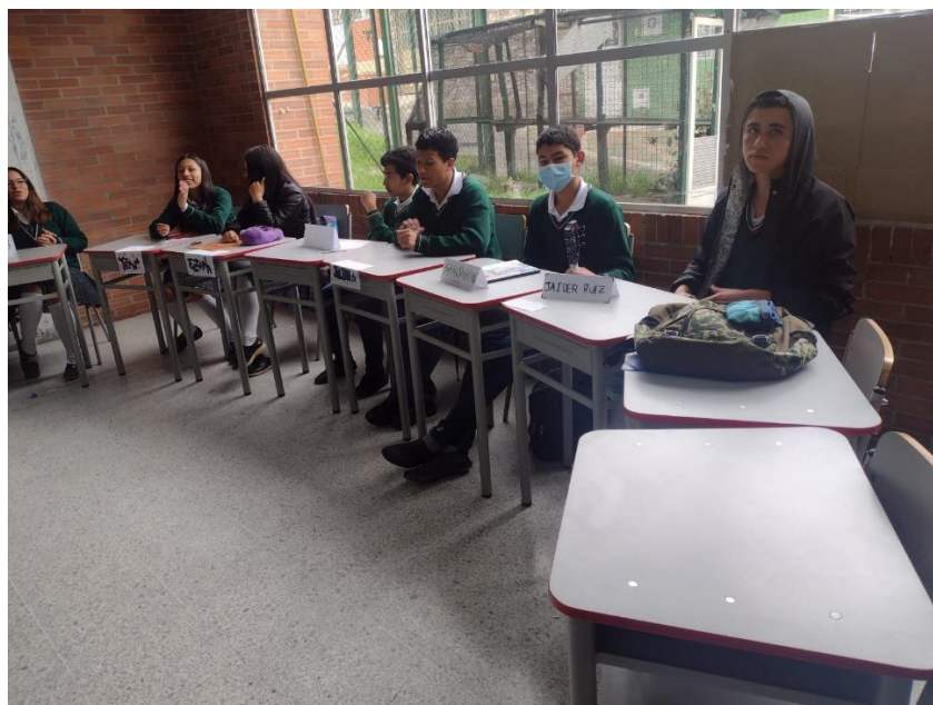
Imagen 2. Sesión de trabajo alumnos 903 del I.E.D Oswaldo Guayasamín-

necesario aclarar que con el curso 803 se empezó una proyección del modelo SIMONU, luego, con el mismo curso en el siguiente grado se trabaja la propuesta de JDTS.