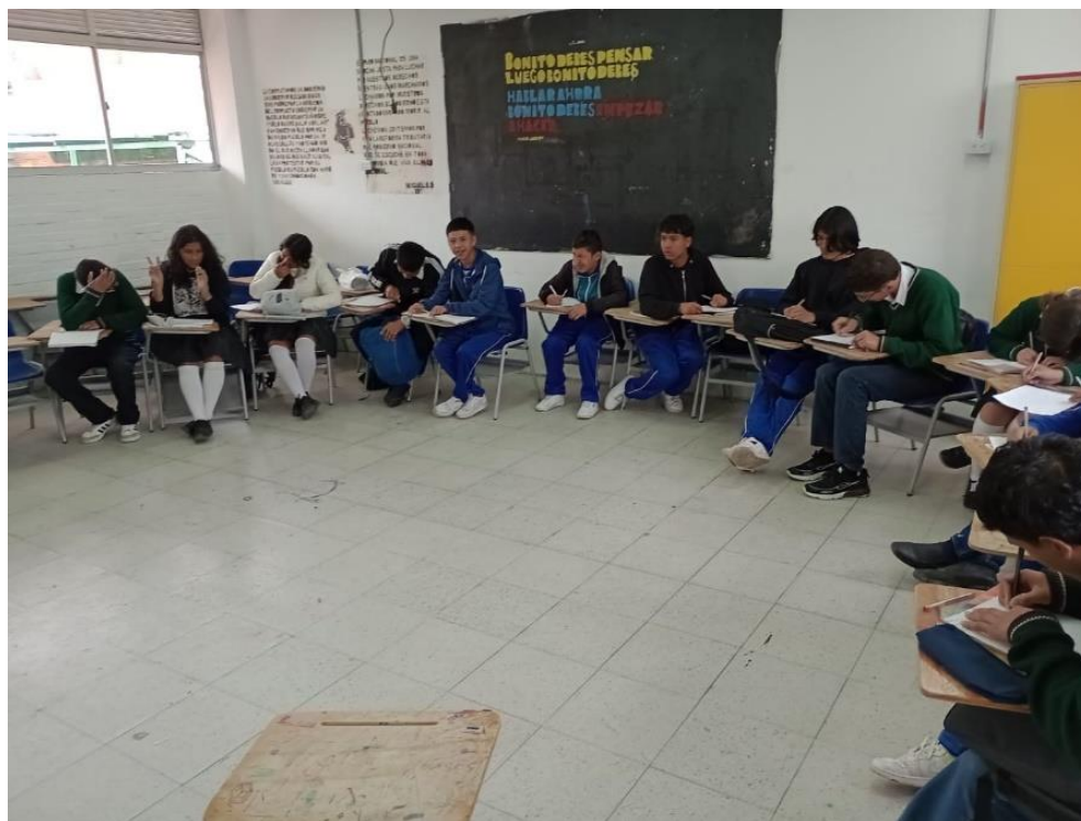
Imagen 1. Mesa redonda con el curso 903 del I.E.D Oswaldo Guayasamín.

es la preparación del debate sobre el tema del aborto y se programa para la quinta sesión de las prácticas, es decir, la práctica del día 20 de abril del año 2023 23 .