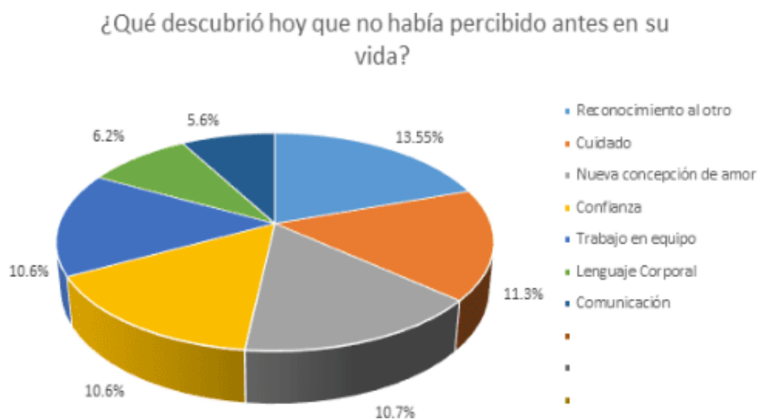
Gráfico 3. Pregunta de descubrimiento.

que suma 11.3% del total de respuestas. También una categoría que se manifiesta es la de una nueva concepción de amor que suma el 10.7%, la confianza y trabajo en equipo ocupan el 10.6% cada una. El lenguaje corporal con 6.2% y la comunicación con 5.6% son otras categorías que, aunque con menos puntos porcentuales son de gran importancia mencionarlas.