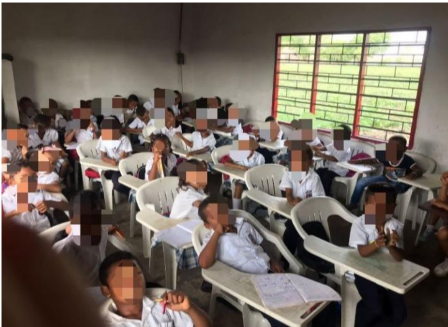
Aula sede La Esperanza

En relación con la figura 5 donde se puede apreciar a los estudiantes en el aula, se puede denotar que la infraestructura dentro del salón es reducida, también se denota: que en el aula los pupitres de plástico no son los más acordes ya que reducen el espacio aún más, de igual manera