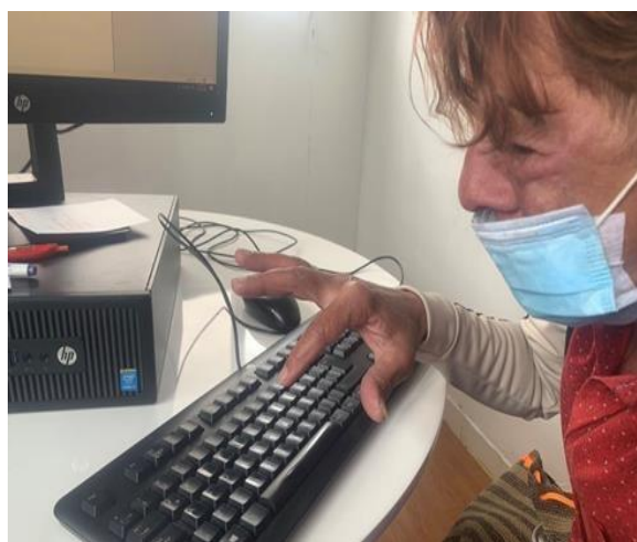
Figura 6 Actividad Aprendamos juntos a escribir que sentimos

Nota: Alfabetización Fundación Casa de Lxs Locxs, 2022.