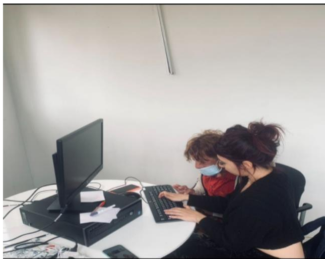
Figura 5 Alfabetización en la fundación.