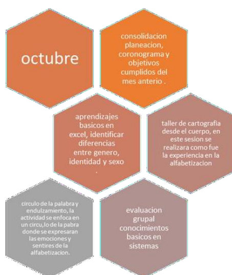
Tabla 21 Actividades octubre 2022