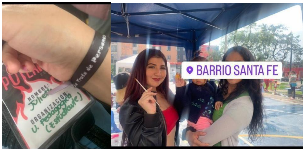
Figura 5 Pedagogía puteril desde las voces silenciadas

Nota: Imágenes tomadas desde cumbre puteril. Archivo personal, marzo 2022.