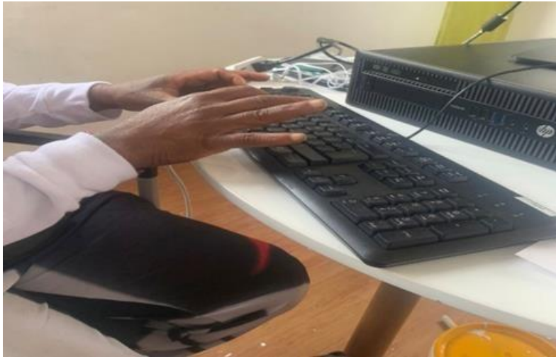
Figura 7 Escribir cuando estamos felices.

Nota: Alfabetización Fundación Casa de Lxs Locxs 2022.