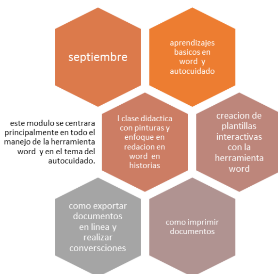
Tabla 16 Actividades cronograma septiembre

A continuación, se analizarán las planeaciones y cronogramas de los dos últimos meses del proceso, examinando los resultados cualitativos y las fortalezas del grupo de alfabetización.