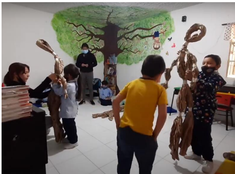
Títeres en el aula con papel Kraft