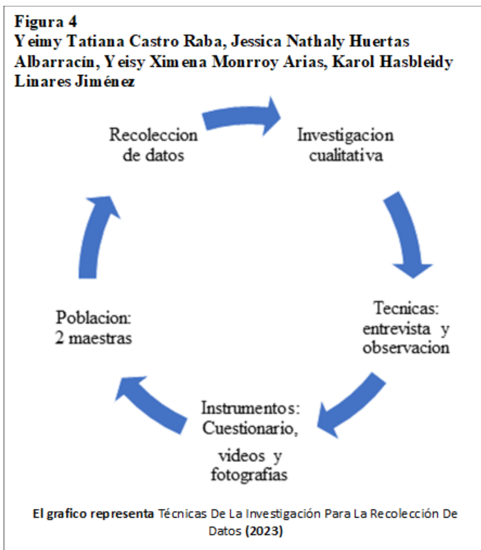
Figura 4 Técnicas de la investigación para la recolección de datos

parte de una concepción del mundo, de afectos socialmente enmarcados y de sentimientos de pertenencia muy fuertes, centrados en la familia y el parentesco y como en muchas de las prácticas mediadas por un dispositivo tecnológico, la fotografía está condicionada en cada momento histórico por sus posibilidades técnicas (Agustina Triquell/2012). En este caso particular, la posibilidad de acceder a un registro fotográfico permitiendo realizar un análisis de su gestualidad, postura y actitud.