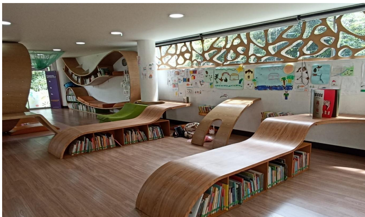
Ilustración 1 Rincón de lectura, Biblioteca El Parque

En la siguiente imagen, se quiere mostrar uno de los rincones de la Biblioteca El Parque, en la cual se ve la distribución de los libros y podemos notar el diseño único que usa esa biblioteca, en la pared se ven dibujos que los niños realizaron con ayuda de las artistas del programa Nidos.