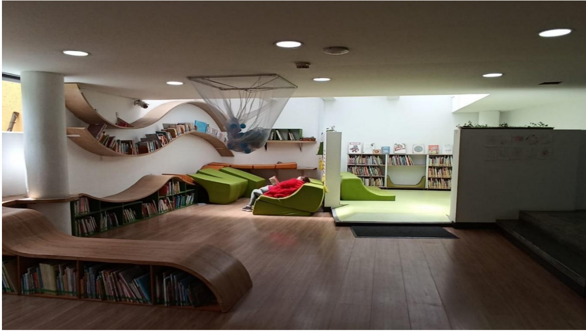
Ilustración 2: Diseño original, Biblioteca El Parque

sillas para que los niños tengan el espacio para desplazarse y moverse con libertad.