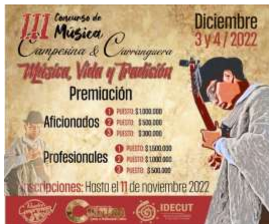
Ilustración 4 Afiche Concurso de música campesina carranguera de Une

Concurso de música campesina carranguera “Música, vida y tradición” realizado en el municipio de Une. Los tres festivales seleccionados se realizan en el departamento de Cundinamarca.