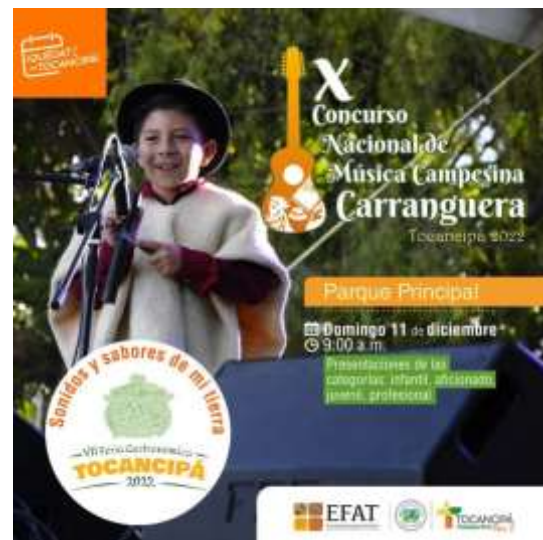
Ilustración 2 Afiche Concurso nacional de música campesina carranguera de Tocancipá

Los festivales seleccionados fueron: el Concurso nacional de música campesina carranguera realizado en el municipio de Tocancipá, el Festival de música Guasca-Carrilera del municipio de Machetá y el