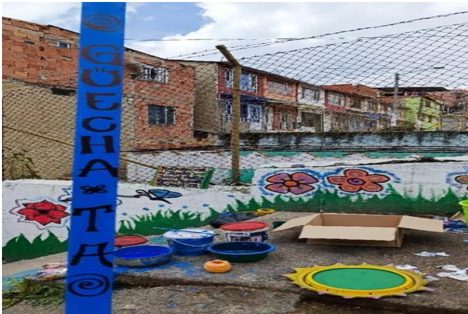
Fotografía N° 5. Pintas de los y las niñas de Montañeros F.C.

Entre las estrategias existieron apuestas y proyecciones que intentaron construir lazos con la comunidad y espacios de encuentro para crear y fortalecer otros vínculos sociales y comunitarios, articulando el arte como alternativa. Es importante resaltar lo que aporta