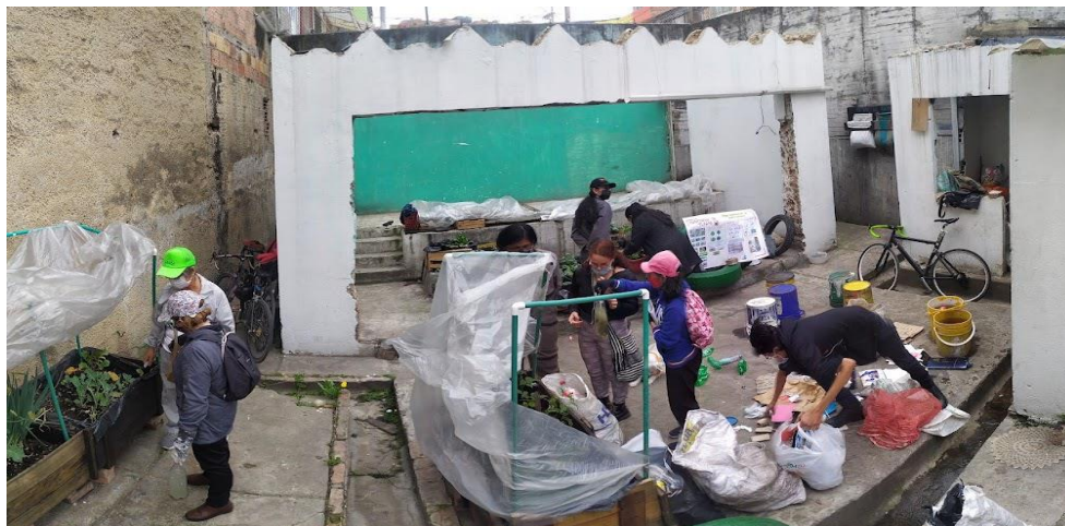
Fotografía N° 4. Las abuelitas esperando a que iniciara el taller.

Se encuentra enfocado a generar conciencia sobre la soberanía alimentaria, así mismo se presenta una reflexión y una crítica a los procesos gestados por las grandes empresas las cuales manejan y tratan los alimentos que se consumen cotidianamente. Con relación a lo anterior, según el Ingeniero Ambiental, Andrés Felipe Páez afirma: