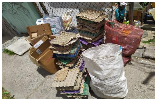
Fotografía N° 2. Residuos aprovechables ya separados.