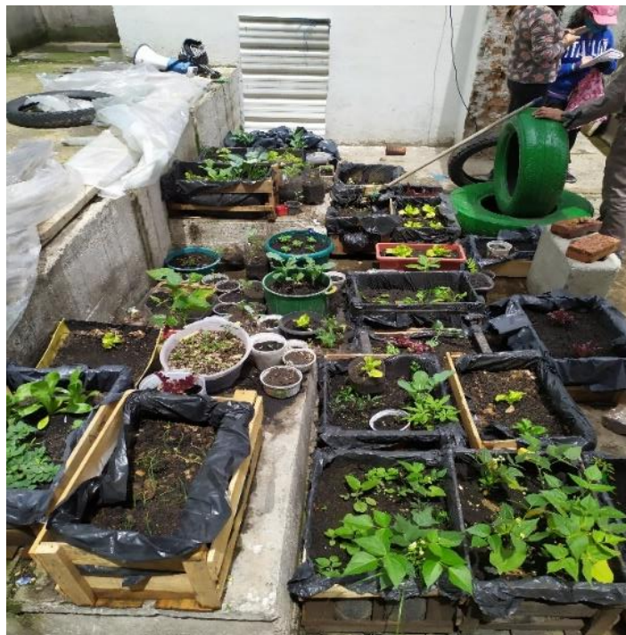
Fotografía N° 3. Camas donde se sembraron diferentes plantas.

La huerta contaba con algunas camas para sembrar o trasplantar plantas que necesitaban más espacio para su germinación y también semilleros hechos por los y las participantes de la escuela de futbol popular Montañeros . Asimismo, se intentó construir con los y las participantes en conjunto con Güecha Ta , el proceso de agricultura urbana para iniciar actividades educativas intencionadas, y así reconocer y concientizar sobre la falta de cuidado en cuanto a las maneras como se habita el territorio, las cuales tienen incrustadas las diversas problemáticas, conflictos, violencias, vulneraciones e injusticias vividas y que son poco evidenciadas por todos y todas quienes viven en el sector del Peñón del Cortijo.