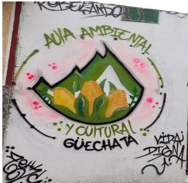
Fotografía N°1. Grafiti simbólico que representa la huerta.

El Aula Ambiental y Cultural GÜECHA TA es un proceso popular y comunitario que se gesta al sur de Bogotá, específicamente en la localidad de Ciudad Bolívar, localizado en la zona del Peñón del Cortijo; junto con Montañeros F.C. , hizo parte del colectivo Re-velando la Montaña .