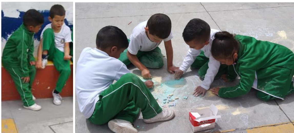
Fotos 6 y 7: Acercamiento ameno (comunicación, convivencia, empatía).

fuera de la actividad, como se puede observar en el d.c 9 y en las fotos 6 y 7 en donde vemos al estudiante trabajar en grupo, integrar a Kevin y decirles a sus compañeros que no podían sacar a uno de la actividad porque él se iba a sentir muy triste y era malo hacerlo sentir así.