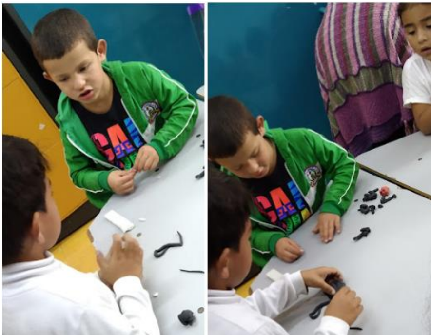
Foto secuencia 13: Respiramos juntos (convivencia y comunicación, emocionalidad)

En la quinta intervención, El silencio cuidadoso se logró percibir en distintos momentos los avances que se alcanzaron hasta ese punto de la propuesta, sin embargo, el nuevo reto también nos permitió identificar algunos aspectos a reforzar para alcanzar nuestro objetivo de generar más interacciones amables entre los niños de grado transición. Lo primero que se pudo observar fue el impacto que generó emocionalmente en los niños y las niñas ver llegar el munanigrito , los estudiantes demostraron por medio de la gestualidad y de sus posturas corporales cómo les afectó el hecho de ver llegar este elemento tan extraño al salón de clase.