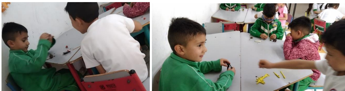
Foto 11 y 12: ¿Trabajamos juntos? (comunicación, vínculos y convivencia).

Es por ello que para nosotras resultó fundamental darle la oportunidad a los niños de trabajar con diferentes personas para que tengan la posibilidad de conocer a todos sus compañeros, interactuar con ellos y compartir para generar interacciones amables con quienes no habían interactuado anteriormente.