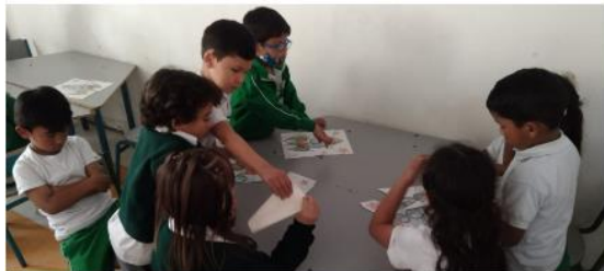
Foto secuencia 20: ¡Ya no quiero nada ¡(emocionalidad, comunicación, convivencia y vínculos)