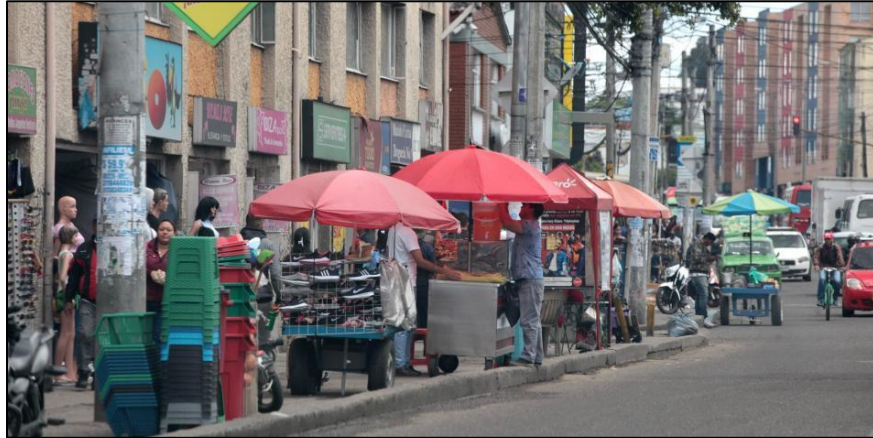
Localidad de Fontibón. Imagen tomada de: El Tiempo 6

periferia de Bogotá pero que generan un impacto todavía en esta zona tan urbanizada de Bogotá a pesar de su contacto cercano con la periferia (Medina, G. F., 2010).