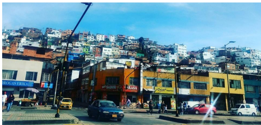
Foto tomada de: Revista Cerso setenta, Universidad de los Andes (s.f) 4

Los datos derivados de las investigaciones acerca del impacto de la contaminación en ciudades como Bogotá, han puesto a los gobiernos y las organizaciones sociales lo mismo que a los científicos y al mundo de la academia a pensar acerca de soluciones que mejoren la calidad de los recursos necesarios para la vida, entre ellos los más importantes: aire y agua, y por supuesto el espacio vital de los ciudadanos. Pero de otra parte también se ha pensado en el contenido simbólico que representan los árboles arbustos y plantas para una ciudad como Bogotá, cuyo entorno se ha deteriorado en las últimas décadas debido a la proliferación de habitantes con un bajo control en el manejo de las basuras, los residuos orgánicos y en general con el uso mismo del espacio el cual ha sido invadido de muy diversas maneras.