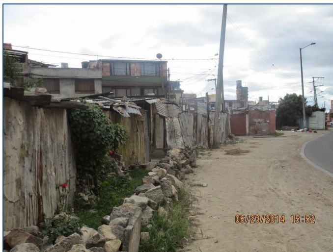
Imagen del Barrio Britalia, Localidad de Kennedy Imagen tomada de: A Media cuadra, prensa alternativa 5

para el tránsito de los ciudadanos. Este es el caso de zonas como Soacha específicamente altos de Cazucá, algunas fracciones de la localidad de Ciudad Bolívar y otras que se encuentran al occidente de la localidad de Fontibón, y en Kennedy cerca al a barrios como Britalia, María Paz y Patio Bonito, al igual que otros sectores de la localidad de Bosa especialmente aquellos que colindan con la autopista sur en la salida de Bogotá (Silva, A., 2003).