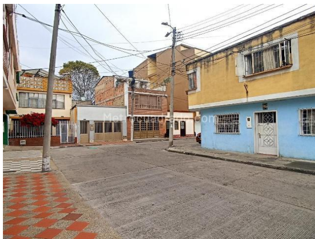
calle del barrio Vilemar 2009

La UPZ Fontibón concentra la mayor cantidad de usos de la localidad. Refleja la composición inicial que tuvo este sector, en su mayoría de tipo industrial y usos anexos a éste.