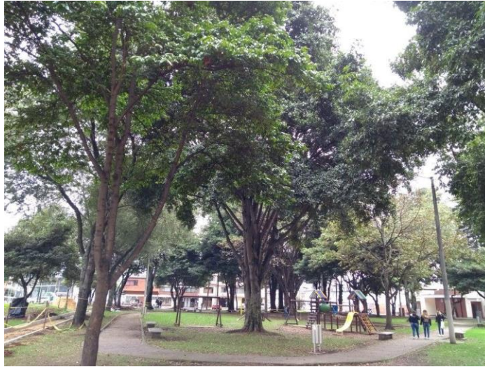
Barrio Modelia (2021)

A medida que la ciudad fue creciendo y se consolidaron zonas aledañas a Modelia, tales como Capellanía, Santa Cecilia y El Salitre, se comenzó a dar una integración verdadera con la urbe, ya que el barrio estuvo aislado de gran manera de las dinámicas económicas y las relaciones de ciudad durante muchos años. Se podría explicar que, a causa de ello, Modelia mantuvo un carácter residencial y de conservación. En los últimos años, Modelia ha sufrido un proceso de expansión del comercio desordenado, las tradicionales calles angostas de un solo sentido: Carrera 75 y Carrera 82 se han convertido en corredores comerciales de alto impacto.