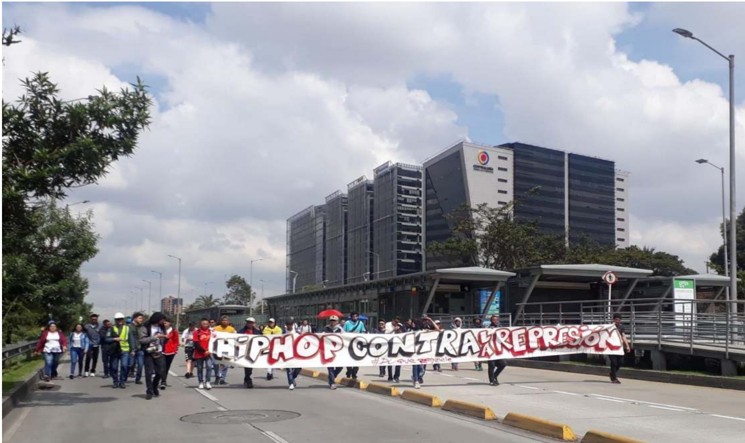
Ilustración 4, participación en las jornadas de movilización 2020

Se decidió entonces como colectividad, participar de algunos encuentros, plantones, movilizaciones de los sectores sociales que se realizaron en la localidad, con el fin de apoyar el gestante paro nacional, la participación del colectivo se dio a manera de acompañar las movilizaciones y las actividades culturales donde se daba la oportunidad para cantar, buscando una consigna que nos acogiera a todos, decidimos caminar la movilización bajo la arenga “Hip-Hop contra la represión” dado que por un lado nos reconocemos como