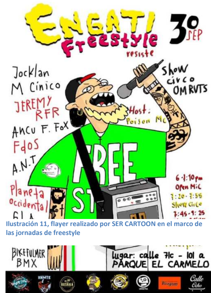
Ilustración 11, flyer realizado por SER CARTOON en el marco de las jornadas de freestyle

Las disposición de las personas en relación a lo que sucede se da de manera circular, todos se reúnen alrededor del objeto o la persona que emite la pista y de manera aleatoria alguien se aventura a ser el primero en cantar, mientras ese alguien canta , el resto atentamente escucha , esperando el momento en que este se detenga para que inmediatamente esto suceda otra persona se aventura en seguir la rima, generalmente a partir de la última oración o palabra se marca la pauta de lo que la otra persona cantara, como siguiendo la idea, o bien sea confrontándola, es decir si al final de mi improvisación por ejemplo: “el derecho de los mías, siempre fue vivir en paz, sin embargo los de arriba nos quisieron subyugar” lo más recurrente ere que la otra persona iniciara contando en relación a eso por ejemplo: “sin embargo yo te cuento , que pese a esta condición, mucho ya hemos alcanzado gracias a esta convicción”.