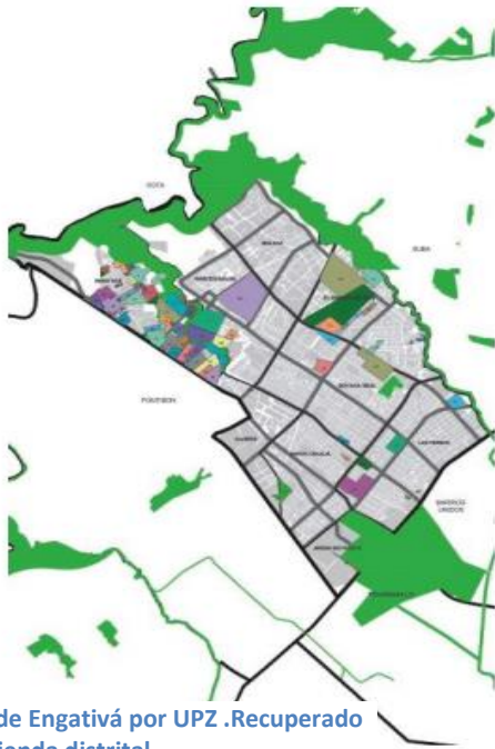
Ilustración 2, Mapa de Engativá por UPZ .Recuperado de secretaria de hacienda distrital https://www.shd.gov.co/shd/sites/default/files/documentos/Recorriendo%20ENGATIVA.pdf