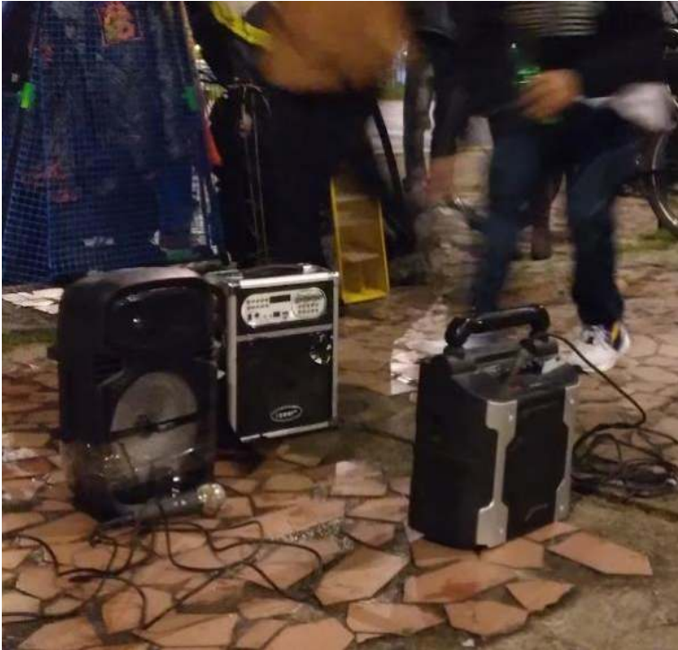
Ilustración 10, jornadas de freestyle, los parlantes.