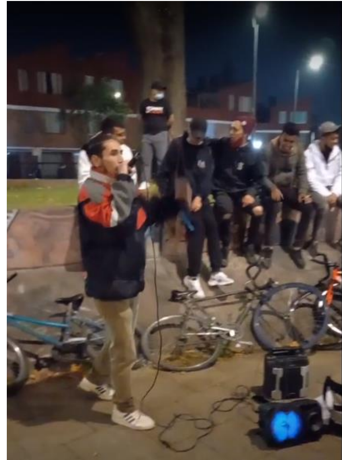
Ilustración 9, jornadas de freestyle

Gestión del espacio: la actividad tiene lugar en el parque el Carmelo y el parque el Pedregal, lugares que solían alternarse dependiendo de la cantidad de personas que se encontraban en los parques, pues siempre se buscaba que no hubieran tantas personas ajenas a la actividad para evitar así tantos distractores, y se pudiera escuchar mejor lo que se cantaba, la decisión surgía de dos formas: