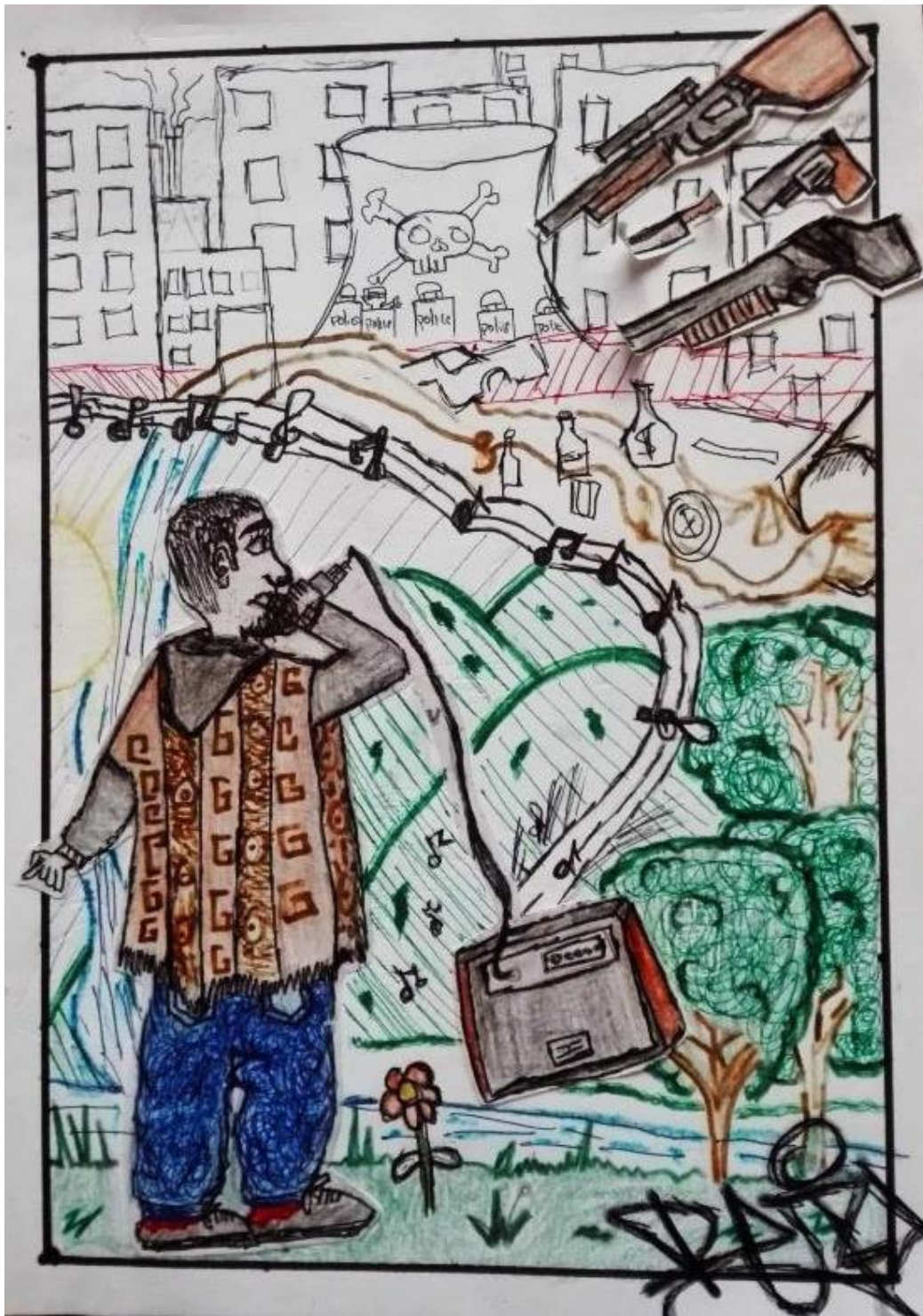
Ilustración 8 Fanzine realizado por Rafael (Johnny Carter)