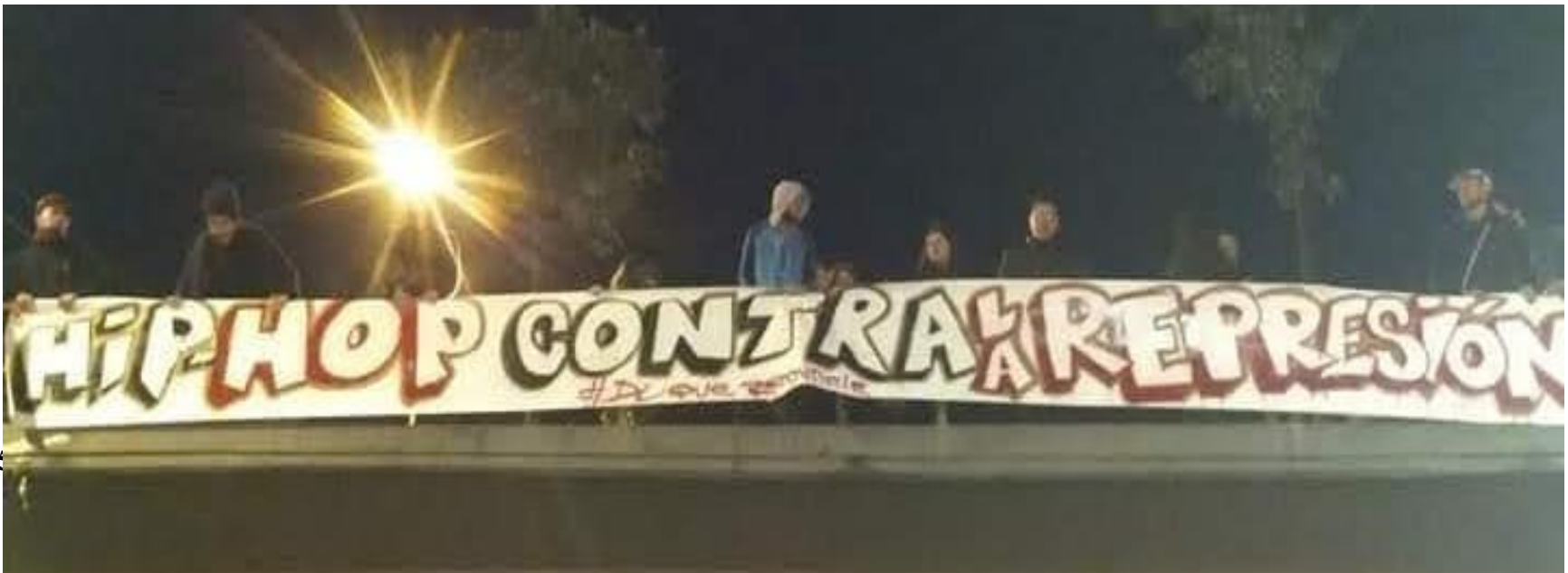
Ilustración 3, h2cr en el marco del paro nacional 2019