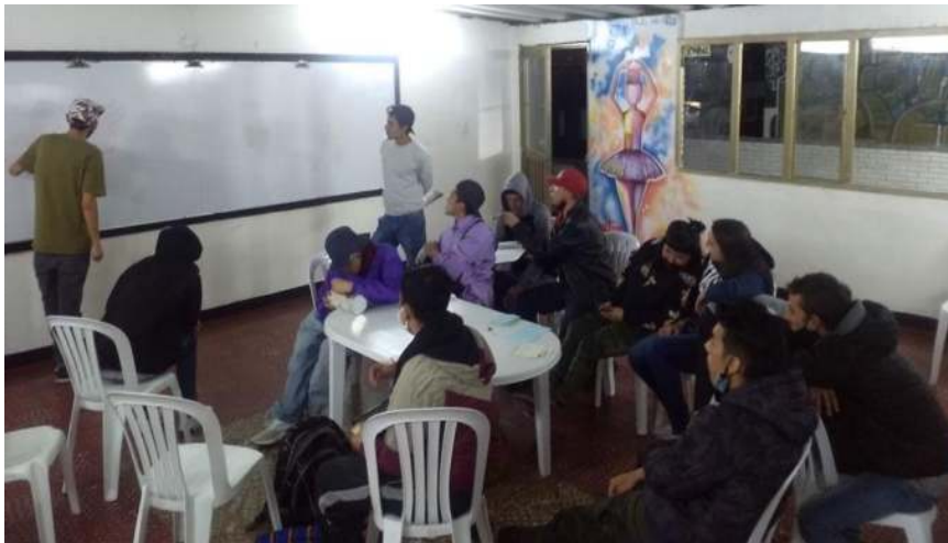
Ilustración 1, taller casa de la juventud