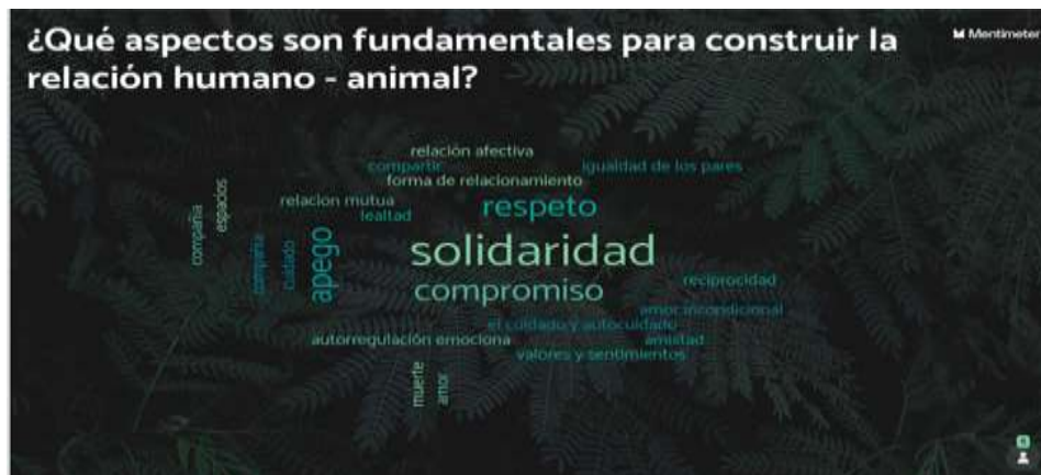
(Ilustración 5. Red Imagina Es Tuyo & integrantes. Taller: los animales como sujetos de protección.2021)