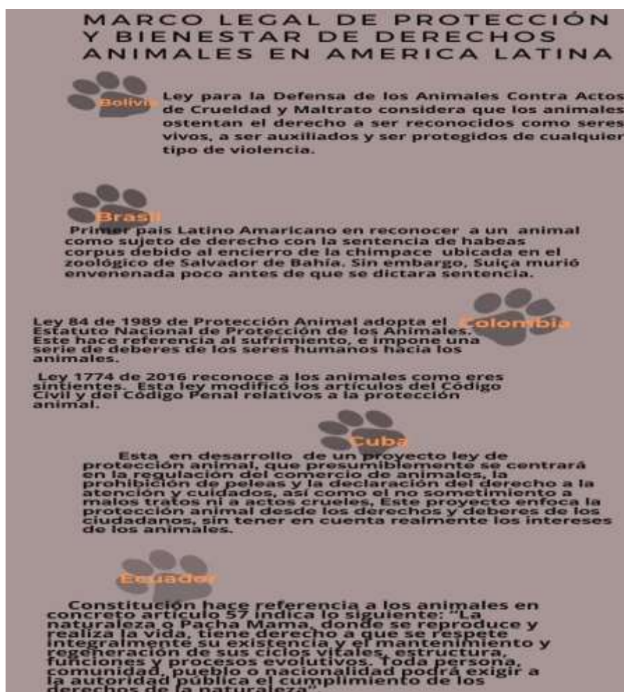
Ilustración. 2. Marco legal

Por lo cual a continuación, situaremos el marco legal en América Latina (ilustración 2) el cual nos expone algunas normativas legislativas y sentencias frente a la titularidad de derechos de los animales teniendo en cuenta que hacen parte de la sociedad garantizando su protección tomando en consideración su desarrollo biológico y el comportamiento natural de los mismos; pues ellos no podrán obedecer la ley, en consecuencia no pueden ser juzgados por su comportamiento, como los humanos para este estado evolutivo, dado que estas acciones deben ser reguladas para que los humanos y los animales puedan convivir pacíficamente en condiciones de igualdad y dignidad.