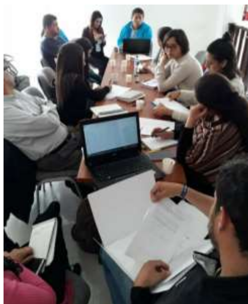
(Fotografía Reunión Consejo Local de Bienestar y Protección Animal. Mora. M. 2016)

A partir del acuerdo 075 se logra conformar el Consejo Local de Protección de Bienestar Animal, algunos integrantes de la red son postulados para ocupar cargos por elección popular esto permitió un diálogo directo con la alcaldía local y la realización de actividades para promoción de derechos animales desde las luchas de los colectivos y movimientos sociales, evidenciando la necesidad de un trabajo cultural de construcción de sentido. La Red ha logrado transformar en la comunidad los marcos de significados en los que se empaquetaban a los animales, girando poco a poco, hacia posiciones menos antropocéntricas.