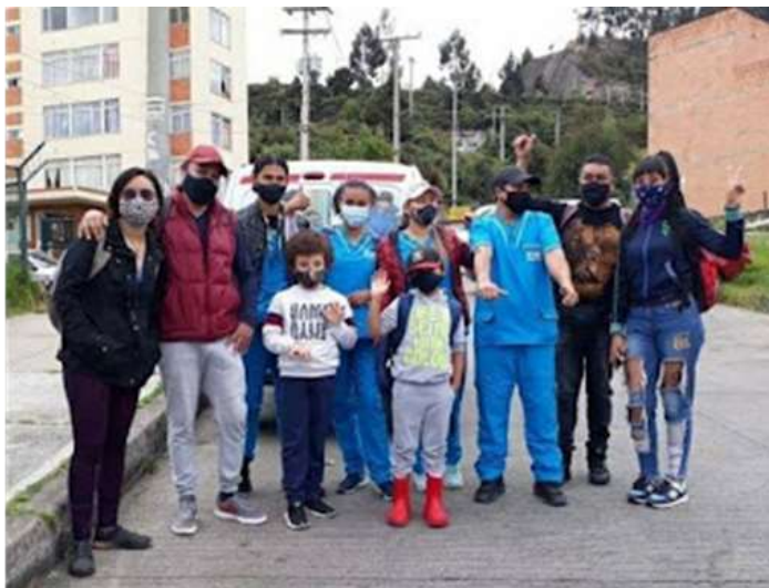
Fotografía jornada de alimentación triangulo alto. Calderón 2021.

De esta manera apuestan a configurar otras formas de vivir en comunidad que se asemejan a los planteamientos del buen vivir al replantear nuestro lugar en la naturaleza desde el ámbito de derechos animales reconociéndose como sujetos de protección y de cuidado y apoyándose para ello en las garantías a sus derechos que ofrecen las entidades encargadas y un cambio en la concepción de las comunidades y la ciudadanía en general.