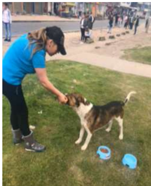
(Fotografía.2 Jornada de esterilización y Fotografía.3 Jornada de alimentación.3.