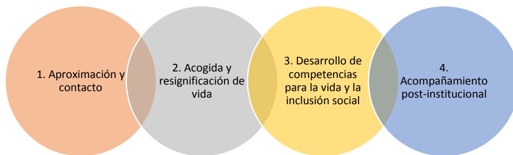
Ilustración 4: PROCESO DE ACOMPAÑAMIENTO IDIPRON.

Dentro del Instituto se encuentra la Escuela Integral IDIPRON encargada los aspectos formativos de los niños, adolescentes y jóvenes que llegan a estos espacios. Tiene como fundamento la aplicación de un modelo pedagógico humanista y holístico, que propicie el desarrollo del sujeto desde lo cognitivo, estético, espiritual, corporal, sociopolítico, laboral, comunicativo, ético, social y ambiental. Dentro de la formación, se potencia: el aprendizaje significativo, comunicación desde la interlocución a partir del diálogo, la reflexión y la problematización; transversalidad de enfoques (derechos, género, diversidad sexual y étnica e investigación).