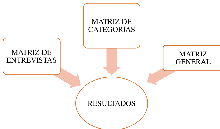
Ilustración 2 DIAGRAMA DE FLUJO DE LA INVESTIGACIÓN. Fuente: Elaboración propia