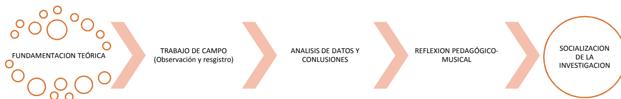
Ilustración 1 RUTA DE LA INVESTIGACIÓN.