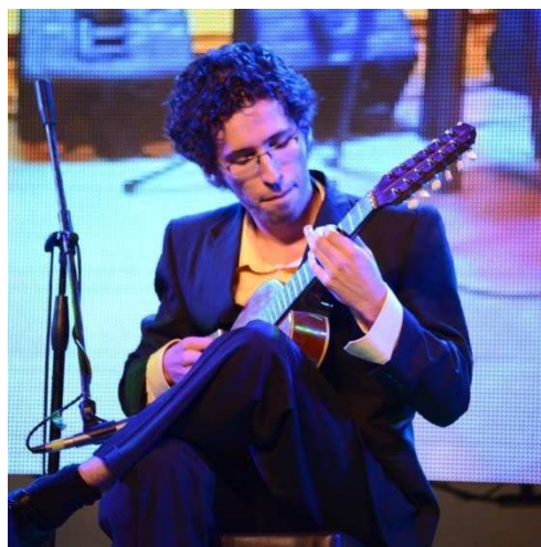
Foto Festival Mono Núñez 2016