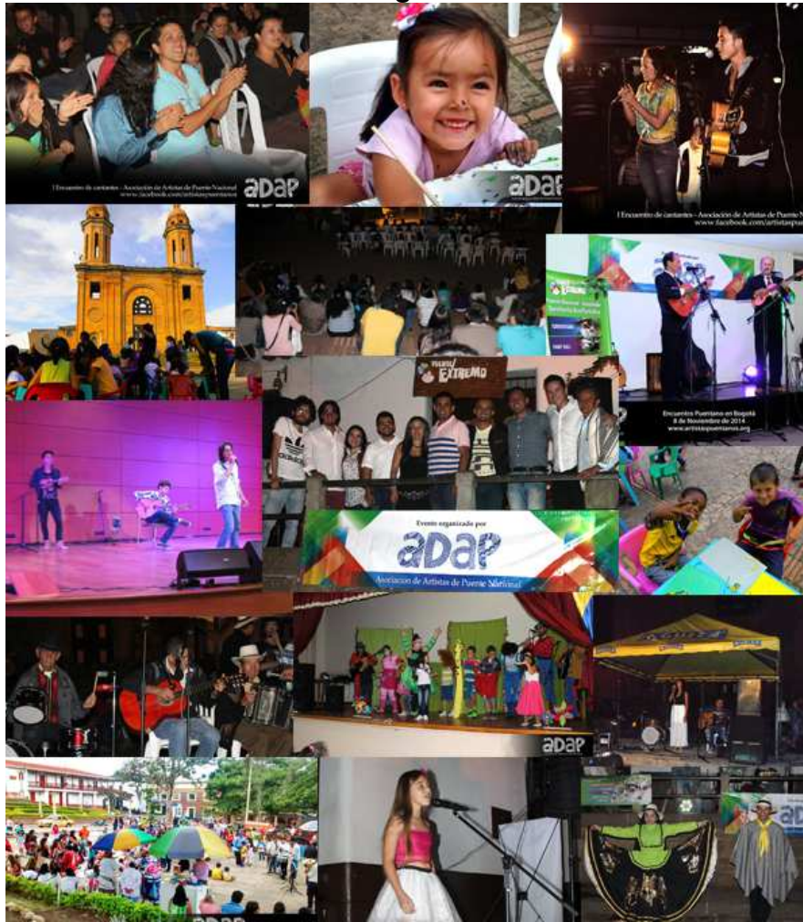
Collage fotográfico eventos ADAP