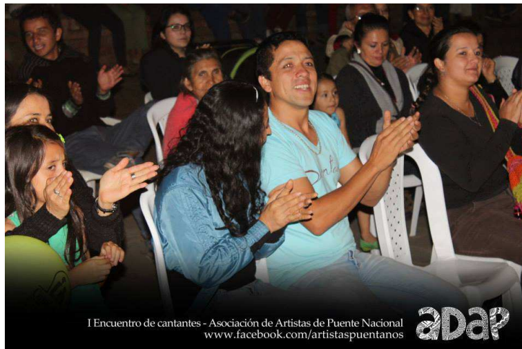
Foto I Velada de Cantantes y Talentos

La experiencia dejó un balance muy positivo frente a la comunidad y sobre todo mucho aprendizaje para la organización, teniendo en cuenta todo lo que se coordinó, en los siguientes eventos se tuvo mayor claridad de cada detalles que debíamos tener en cuenta, sistematizamos, por llamarlo de alguna manera, los procedimientos, los requerimientos y todos aspectos que ayudaría a realización de las siguientes veladas. Con cada una de ellas hemos aprendido para mejorando nuestra capacidad de gestión y acción dentro del trabajo de fomento y desarrollo artístico y cultural del municipio.