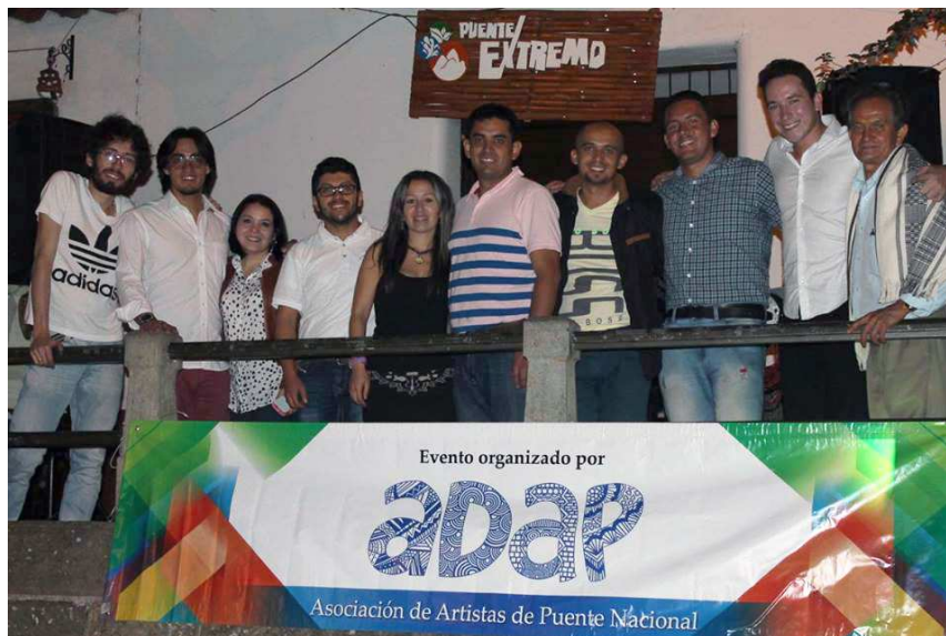
Equipo de trabajo de la Asociación de artistas de Puente Nacional

En esta fase de la organización descubrimos la importancia de estar legalmente constituidos al entender que el panorama de gestión de recursos era más amplio contando con instancias gubernamentales tales como Alcaldías, Gobernaciones, Ministerios, ONG, entre otros.