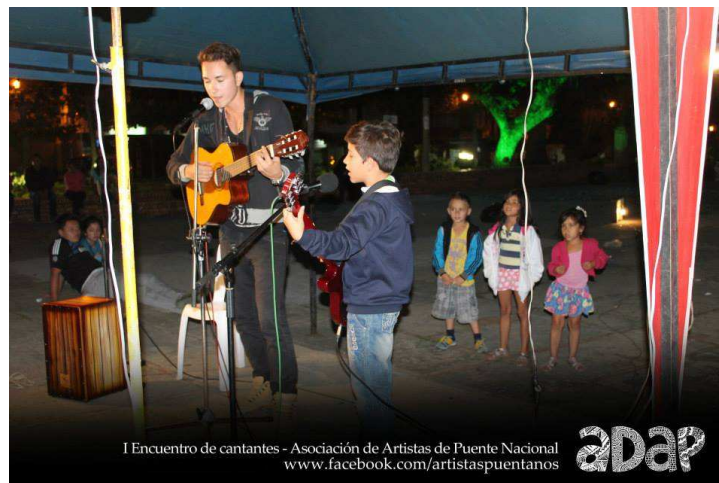
foto I Velada de Cantantes y Talentos

Finalmente llego el día del evento, los gestores que vivíamos en la ciudad de Bogotá llegamos a las 4 pm al municipio para preparar todo para el concierto. A las 6 pm se acercó un funcionario de la electrificadora de Santander y nos pidió el permiso de electrificadora, documento que desconocíamos por completo debíamos tener, el funcionario nos dijo que sin