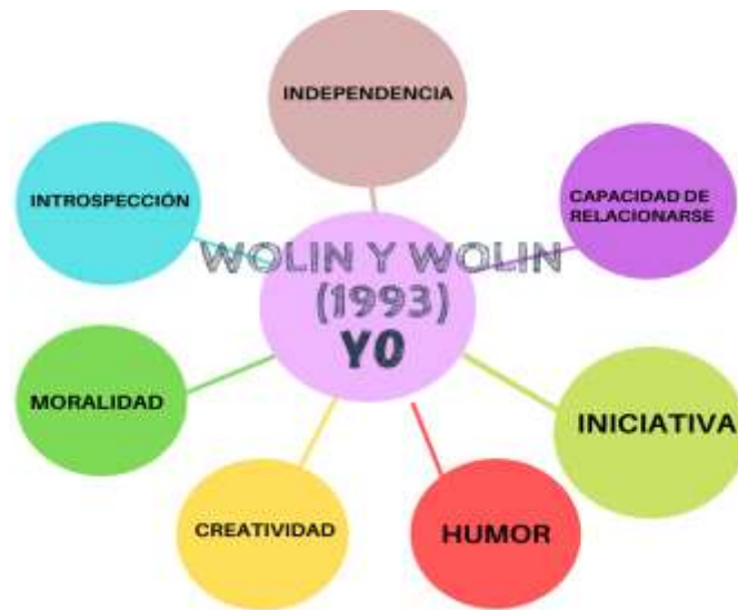
Figura 4. Mándala de la resiliencia según Wolin. S y Wolin. J (1993).

Por su parte, Wolin. S y Wolin. J, (1993) exponen siete pilares que explican las características de una persona resiliente y los representan a través de una figura llamada la Mándala de la Resiliencia , esta explica de manera explícita las capacidades y potencialidades que desarrolla un sujeto resiliente.