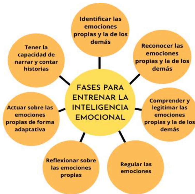
Figura 3. Fases para entrenar la inteligencia emocional según Guerrero (2018). Elaboración propia.

reconocimiento de las emociones propias y las de los demás; la tercera, plantea que el niño debe legitimar las emociones propias y las de los demás; la cuarta, regular las emociones; la quinta, está en el aprender a reflexionar sobre estas, la sexta, busca que el niño actúe las emociones de forma adaptativa y por último, el niño debe ser capaz de crear y narrar historias. Estas fases buscan que el niño se regule y genere tolerancia a la frustración y autocontrol.