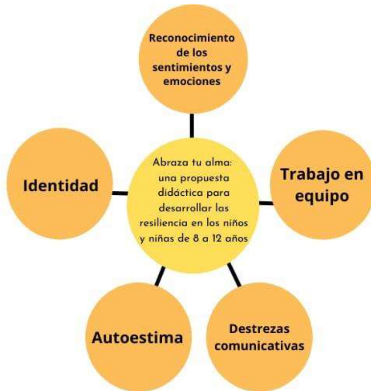
Figura 5. Elementos que constituyen la propuesta Abraza tu alma: propuesta didáctica para el desarrollo de la resiliencia en niños y niñas de 8 a 12 años.

estas cualidades específicamente, las otras pueden aparecer y trabajar de manera indirecta en el mismo espacio.