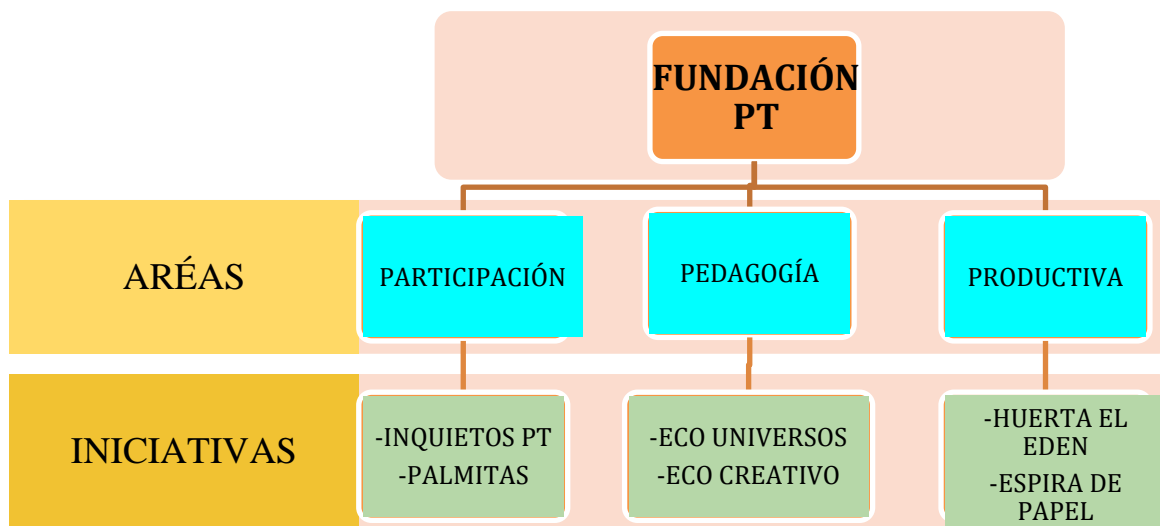
Figura 1. Organización Fundación PT. Elaboración propia.

La Fundación está organizada en tres áreas: