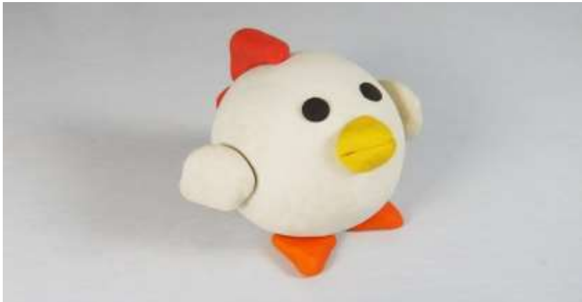
Anexo N°5 figura 5, recuperado de: https://www.pinterest.com.au/pin/393572454940809295/ (Taller 19)