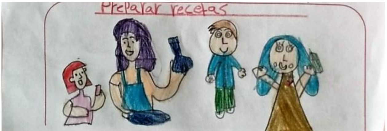
Niña de 8 años, grado 201. Institución Educativa Distrital.

b) La transparencia consiste en representar los elementos como si los que los tapan fueran transparentes y permitiesen ver lo que hay dentro de ellos.