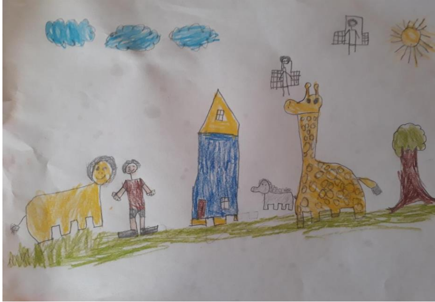
Niño de 8 años. Grado 201. Institución Educativa Distrital.

D. Realismo visual: El realismo visual, según Luquet, excluye los procedimientos dictados por el realismo intelectual. La observación cronológica de los dibujos de un niño permite observar la paulatina desaparición de los recursos gráficos empleados durante el realismo intelectual. Así, la opacidad de los cuerpos sustituye a la transparencia; la perspectiva al abatimiento y al cambio de punto de visión; etc. La inmersión en el realismo visual no es necesariamente definitiva, puesto que, en ocasiones la perspectiva queda falseada, “la razón principal es que el niño dibuja generalmente de memoria y no del natural” y también porque “la perspectiva que aplica a sus dibujos... se debe sólo a recuerdos visuales, a veces lejanos” Luquet en Sáinz, (2002)