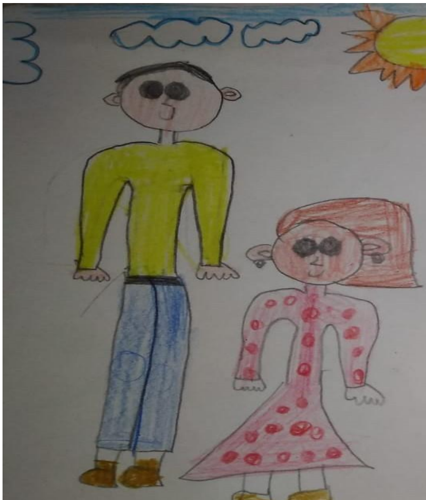
Niña de 8 años, grado 201. Institución Educativa Distrital.

Etapa del comienzo del realismo de 9 a 12 años Durante esta etapa, el niño presta más atención a las proporciones y formas de sus ejecuciones, ya que se aproxima cada vez más a las formas de la realidad visual por lo tanto: “esto le lleva a una nueva actitud crítica hacia el trabajo que realiza, provocándole constantes modificaciones en su manera de dibujar y pintar, y distanciándose de la espontaneidad y la grata aceptación con las que abordaba las producciones plásticas hasta la etapa esquemática” (Sáinz, 2003, p. 170). En términos de Lowenfeld, citado por Sáinz “durante la etapa del realismo, el niño descubre la relación directa que existe entre él, los objetos y materiales que forman el ambiente” (p. 174).