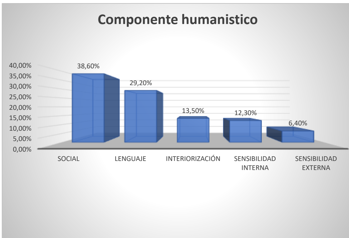
Figura 1 Componente humanístico

Desde este componente tomamos 5 conceptos: social, lenguaje, interiorización, sensibilidad interna y sensibilidad externa para realizar el análisis correspondiente. A continuación, son anunciados en el orden descendente como se evidencia en la figura 1. El concepto con mayor frecuencia es el social con un porcentaje de 38,60%, el segundo es el lenguaje con un 29,20%, el tercero es interiorización con 13,50% y como cuarto y quinto están la sensibilidad interna y la sensibilidad externa que arrojan un resultado de 12,30% y 6,40% respectivamente.