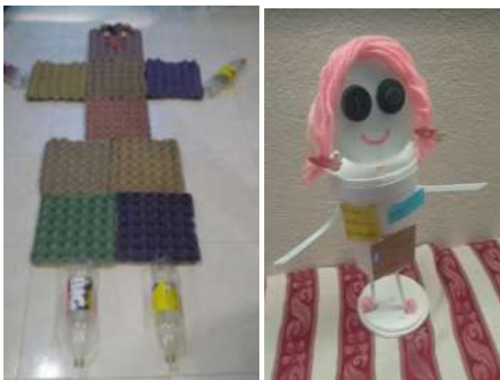
Mi yo y mi sentir (Ubaté 2020)