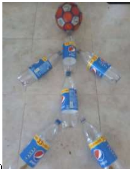
Reconociendo mi entorno lejano y próximo (Ubaté -2020)