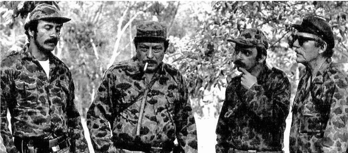
Ilustración 2. Ilustración 2 Iván Marino Ospina, Manuel Marulanda Vélez, Alvaro Fayad y Jacobo Arenas

En 1960 luego del fracaso de la comisión especial de rehabilitación y del asesinato de algunos líderes guerrilleros comunistas, lo que se había convertido en un movimiento agrario retornara a la autodefensa guerrillera, con la llegada al poder de Guillermo León Valencia segundo gobierno del frente nacional, se agudiza la violencia en contra de las guerrillas comunistas y se ordena así en mayo de 1964 el bombardeo a Marquetalia, lo que dará origen a la creación de las fuerzas armadas revolucionarias de Colombia ejército del pueblo (FARC-EP).