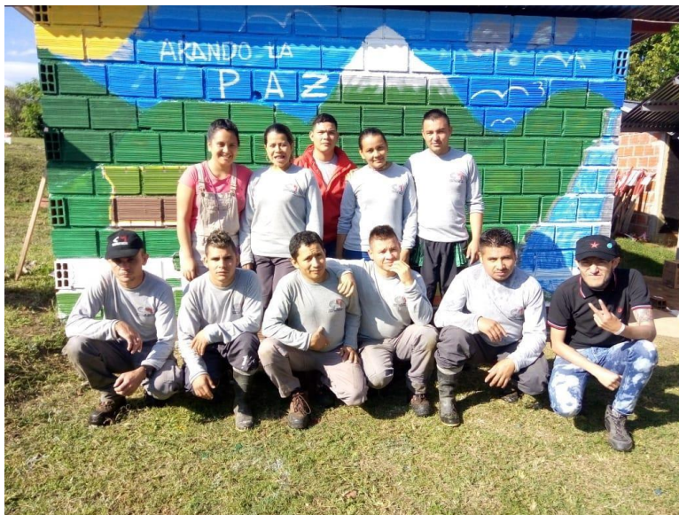
Ilustración 9 Mural cierre de actividades 2018