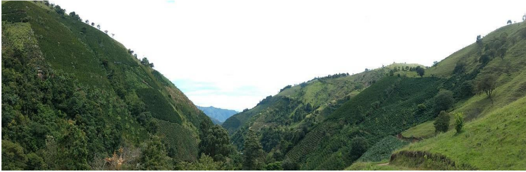
Ilustración 5 Montañas que abrazan a Algeciras, 2019, archivo personal

Ya en la base de CCCM, luego de una breve presentación, me dispuse a acomodarme en los camarotes que compartimos con los chicos de Humanicemos DH y alistar los materiales necesario para realizar el diagnóstico que nos arrojaría los primeros indicios frente a la ruta de trabajo en esta Práctica Pedagógica Investigativa, allí las actividades comienzan desde las 5 am, cuando se levantan los excombatientes a realizar el aseo de la base, antes de que lleguen los administrativos, a las 7 am se desayuna para posteriormente comenzar las actividades, las cuales se dividen en dos bloques, el primero de 8 a 12 y el segundo de 2 a 4, entre 12 y 2 se da el espacio para almorzar y un tiempo libre que muchas se utiliza en algunos casos para descansar y otra para ir a vigilar las huertas, después de las 4 ya se terminan las actividades y se puede ocupar el tiempo para lo que se desee, algunos bajan al pueblo, otros descansan, juegan, ven tv o se aprovecha el tiempo para adelantar trabajos que les dejan a quienes están estudiando diplomados o adelantando sus carreras a distancia.