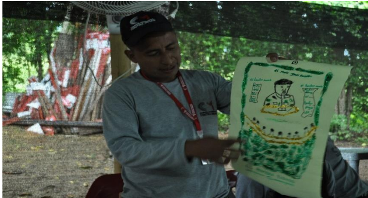
Ilustración 8 El hombre nuevo. 2019