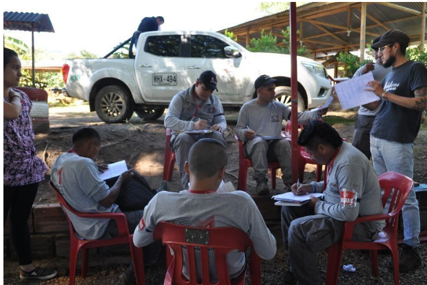
Ilustración 7: Actividades, 2019

El último día en terreno era el Sábado, generalmente siempre estamos de lunes a sábado, y este día a lo largo de todas las prácticas, lo utilizamos para implementar en horas de la mañana una evaluación de manera cualitativa, donde se recogían de grupo sugerencias frente a las actividades, y con base en esto estructuramos las del próximo encuentro, teniendo en cuenta el objetivo final, ya con esta actividades recogimos lo que nos sugirieron incluyendo el interés de ellos por la apropiación de la ofimática, con esto culminamos y a eso