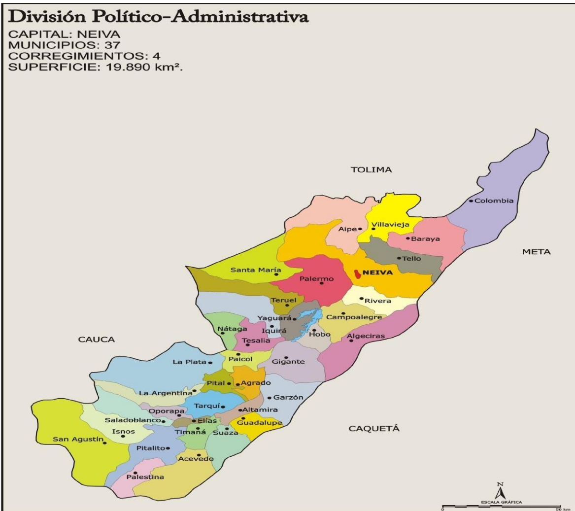
Ilustración 1. Ilustración 1 División política del departamento del Huila ( https://sites.google.com/site/implementaciondelarazaalpina/marco-referencial , s.f.)