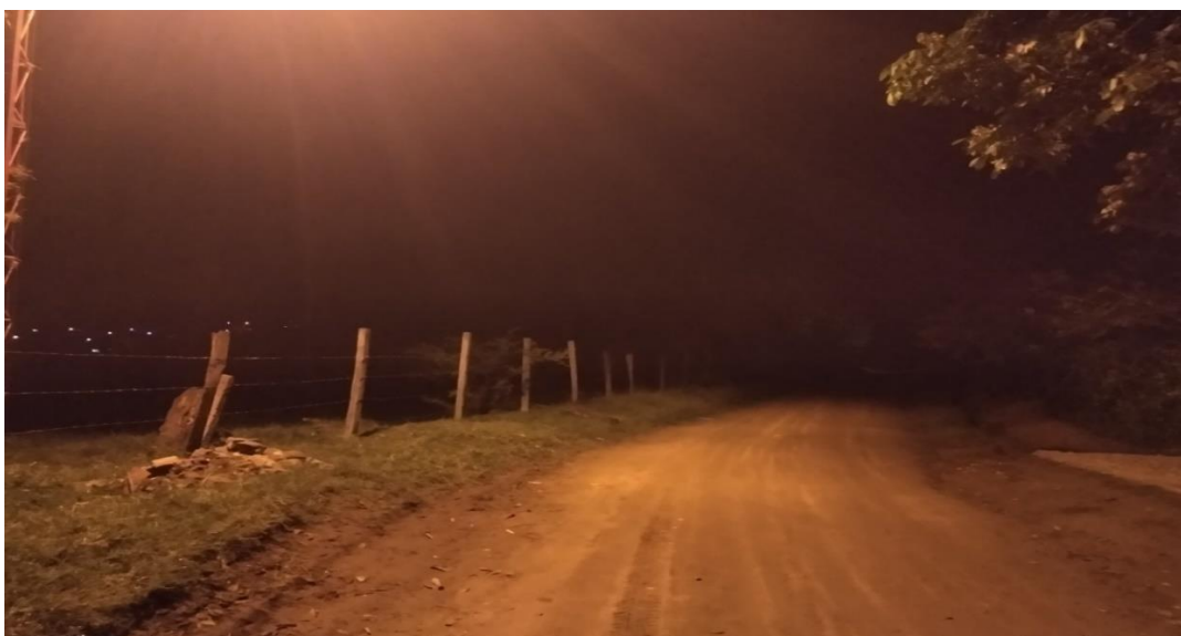
Ilustración 4. Por aquel caminito de un filo llegue, 2018

“Hemos visto la selva demolida por los bombardeos de la Fuerza Aérea. Hemos visto centenares de árboles mutilados, ennegrecidos y molidos por la pólvora, levantando al cielo sus desnudos brazos quemados. La vida se silenció en esos lugares desde entonces.” (Márquez & Santrich, 2020, pág. 59)