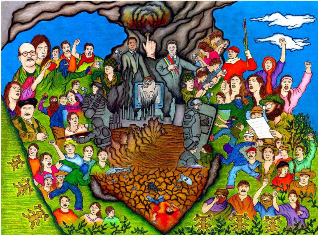
Ilustración 10 Desenterrando memorias- Fuente galería de la artista Inty Malaywa ETCR Amaury Rodríguez

De este modo se hace evidente la relación que marcaba lo formativo con la cultura y el arte dentro de las FARC-EP, pues esto también fue utilizado para dar a conocer su proyecto desde adentro, su historia contada desde los protagonistas, de cierta forma expresiones artísticas y culturales contrahegemónicas que invitaban a todos y todas a encontrarse con ellos en la búsqueda del SOCIALISMO como medio de los cambios sociales en la construcción de condiciones dignas para los explotados. Así lo evidencia un fragmento de la siguiente composición musical: