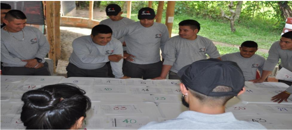
Ilustración 6 Actividades, 2019

proyección de la película “La Estrategia del caracol” y un posterior debate frente a la misa.