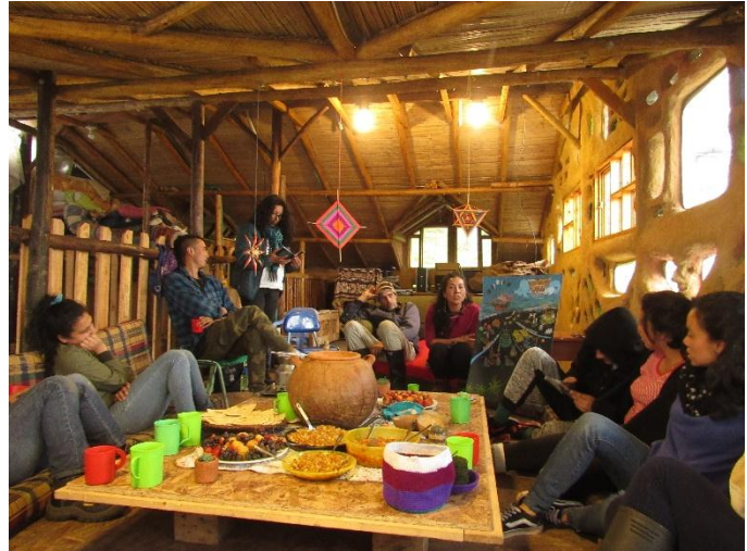
Fotografía 26 Retroalimentación por parte de la comunidad. Nov. 2019