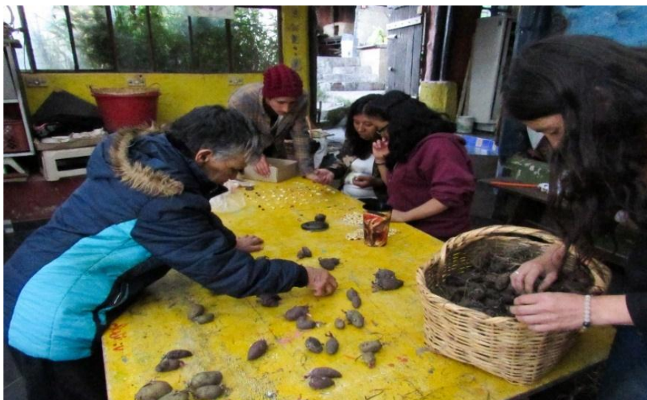
Fotografía 17. ¡Clasificando las semillas para la siembra! 2018, Archivo Personal.

Esta hebra que se entrelaza con esta categoría es una apuesta que pervive en Casa Taller las Moyas, la cual desde sus prácticas ha potenciado el reconocimiento y la memoria guardada en las semillas, gestando procesos educativos a partir del diálogo de saberes con abuelas, niños, visitantes, colectivos y estudiantes universitarios, lo que ha ido promoviendo apuestas políticas frente a la soberanía y autonomía 17 alimentaria, resguardando semillas limpias y nativas.