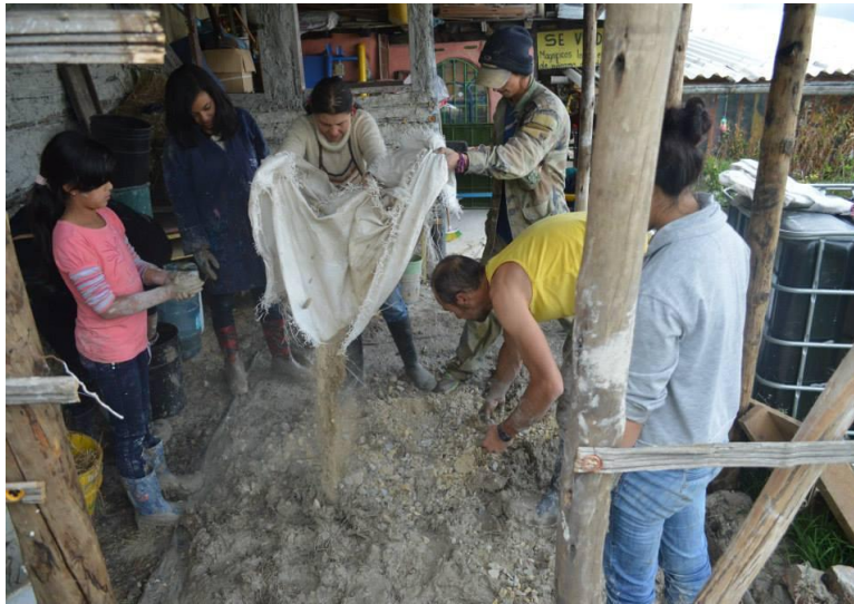
Fotografía 11 Trabajo Colectivo, "aprender viviendo", 2011.

...A partir de identificar la necesidad de construir espacios para la comunidad donde podamos encontrarnos como familia y reivindicar algunas de las relaciones que se dan como actores sociales dentro de la comunidad ...Pienso que Casa Taller es una experiencia vivencial es una forma de aprender viviendo. (Díaz N, tomado de (La maquina del tiempo, 2015)