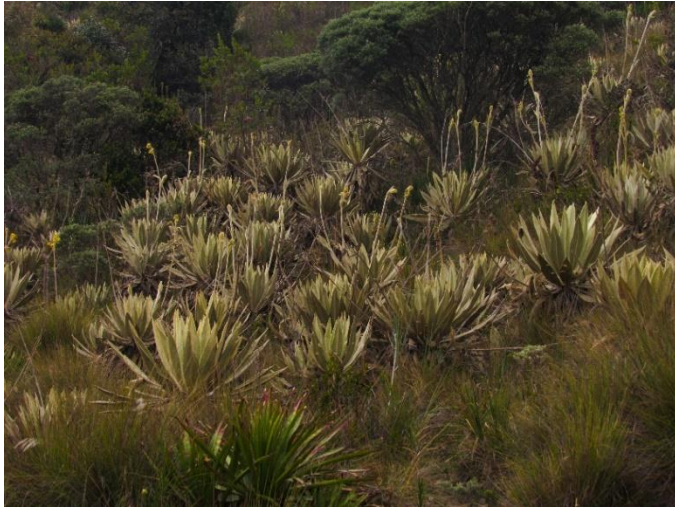
Fotografía 4 Páramo de las moyas. Nov. 2018.