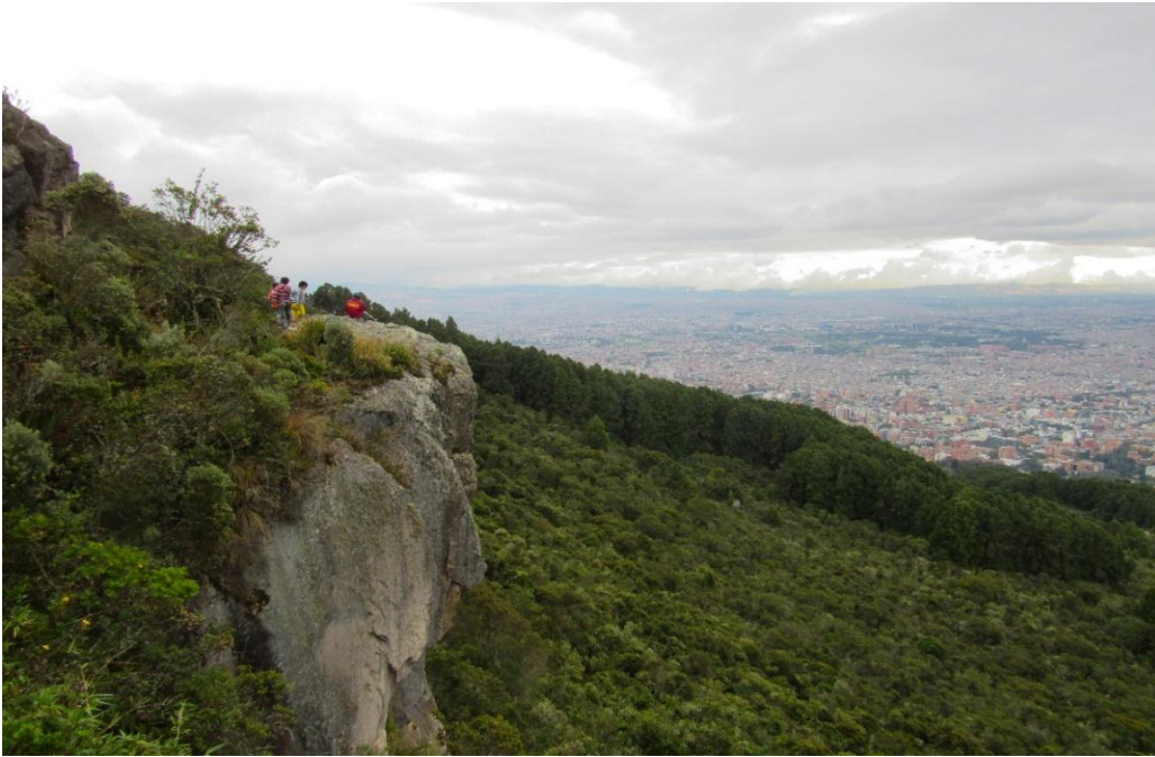
Fotografía 1 Cerros Nororientales de Bogotá. 2018.

Para iniciar el recorrido por esta sistematización de experiencias se hará un reconocimiento de aspectos geográficos, ambientales, sociales, culturales y políticos, que han configurado las dinámicas del territorio en donde se encuentra Casa Taller Las Moyas de Niños y Jóvenes una organización popular ubicada en la localidad de chapinero alto en la ciudad de Bogotá.