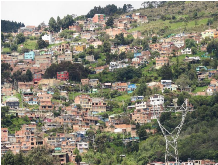
Fotografía 2 Barrio San Luis, Chapinero Alto. Mayo 2019.

Sin embargo, las dinámicas sociales y culturales en este territorio han ocasionado el deterioro e impacto negativo a los ecosistemas debido a prácticas como quemas, tala de bosques, construcción de viviendas, manejo inadecuado de basuras, a pesar de esto existen habitantes que han logrado reconocer su territorio, vivirlo, cuidarlo, protegerlo y disfrutarlo.