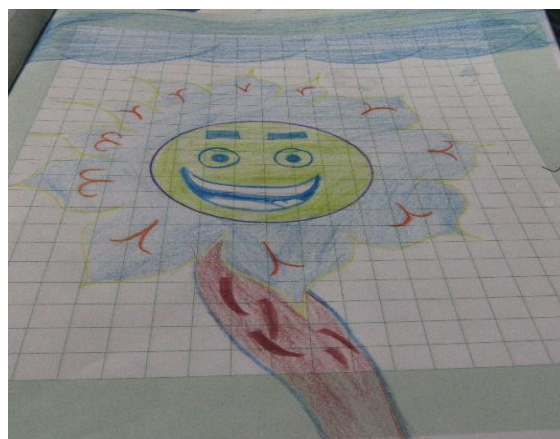
Fotografía 21 Las plantas están vivas porque son muy lindas tienen colores y nos alimentan” Taller plantas medicinales. Dibujo realizado por Brayan, 11 años, marzo, 2018.

Lo que me gusta de Casa Taller es que uno puede salir a experimentar cosas que uno en el colegio no lo dejan, por ejemplo, conocer plantas...en el colegio no hay plantas, por eso no nos enseñan cómo se llaman. (Sol Angie, 2019, Niña de 10 años, tomado de Cárdenas A. , 2018)