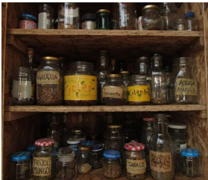
Fotografía 18 Custodio de semillas, 2019

El resguardo de semillas en esta organización y los talleres que se realizan respecto al tema son vitales pues gestan diálogos intergeneracionales que permiten hacer conexiones con el legado de nuestros ancestros cultivadores de la Tierra, posibilitando hacer resistencia frente a las dinámicas capitalistas las cuales se