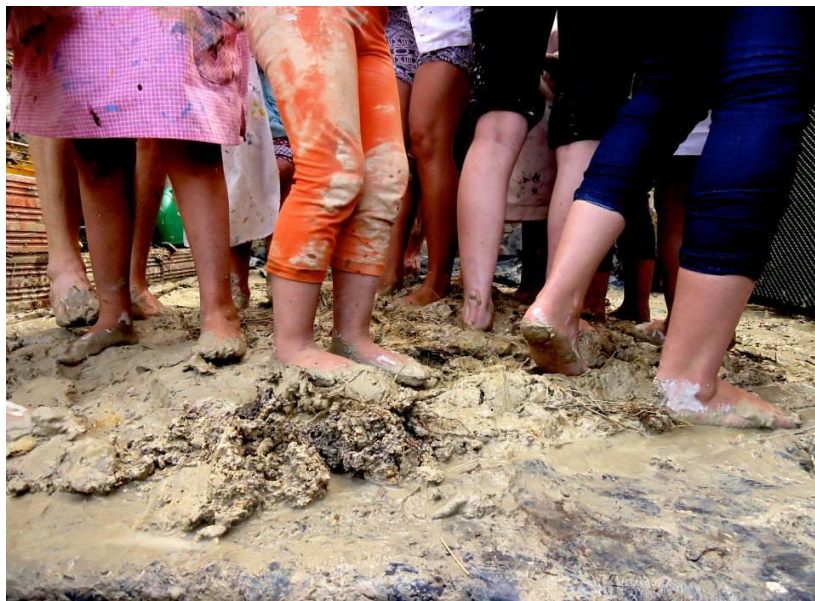
Fotografía 10 Trabajo colectivo, amasando bareque para la cocina campesina. Sep. 2014.

Lo de bio-construcción , nosotras lo aprendimos a través de un proyecto que tenemos que se llama escuela viajera... y estuvimos hace unos años y varias veces hemos ido a Raquira porque halla también hay un proceso fuerte de Muiscas y ellos son amigos de nosotros y conocen este proceso hace muchos años también... ellos estaban haciendo su casa en Bio-construcción y nosotros les ayudamos hacer su casa , entonces desde ahí como que nació ese interés por la bio- construcción , al ver que ellos tenían bastante avanzada su casa y al ver que había otras formas de construir y desde ahí nos motivamos a hacer en esta casa la bio- construcción...(Sánchez, T , 2019, anexo N°6 )