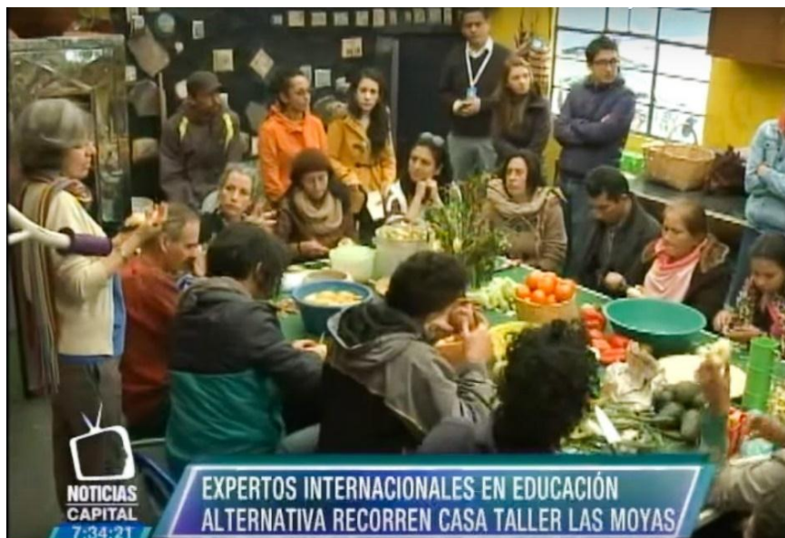
Fotografía 24 Semana de la educación alternativa en Bogotá. 2015.

“Lo que más interesa de estos espacios educativos es que no reproduzcan en ningún momento la lógica escolar, considero que cuando se crea una comunidad, en el que se ofrecen herramientas para la juventud y no se reproduce el modelo de la escuela con