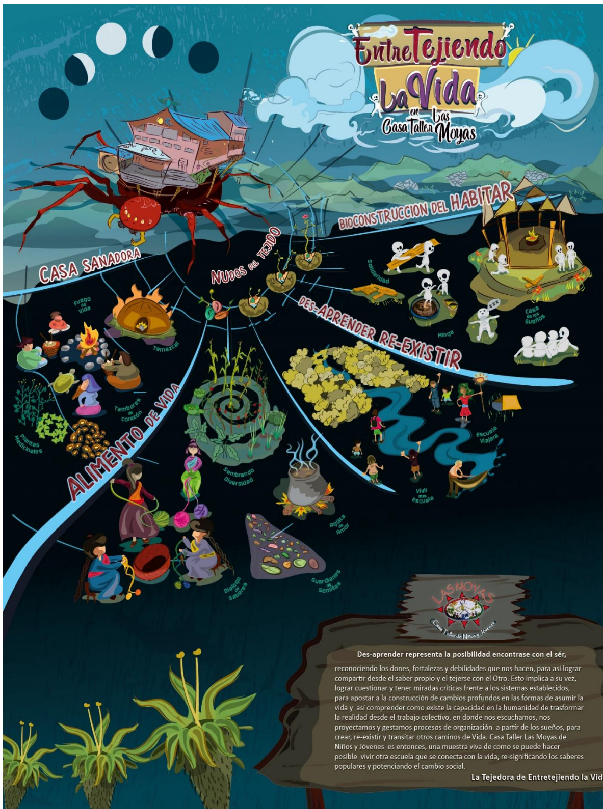
Figura 3. Representación gráfica de las categorías de análisis en la organización popular Casa Taller las Moyas. Ilustración por Fernando Cendales. 2019