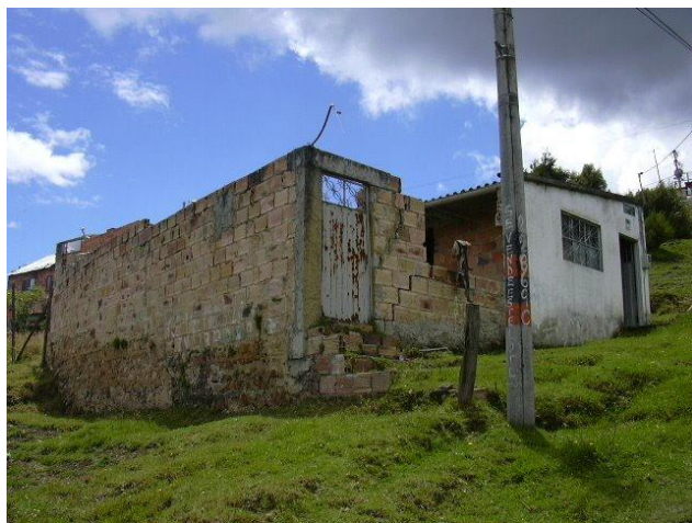
Fotografía 8 Inicio de un sueño, terreno inicial para construir Casa Taller Las Moyas. 2005

Este hilo que se ha ido tejiendo a través de los años representa la manera como se ha hecho tangible un sueño desde la entrega de vida por la comunidad, es así como esta categoría dará cuenta de como se ha configurado este proceso desde la construcción de un espacio físico para convivir, habitar y aprender a partir del diálogo de saberes, lo que ha permitido recordar prácticas de bio-construcción 10 a través de la utilización de técnicas y materiales de la naturaleza, es así como desde la construcción de Casa Taller La Moyas es posible reconocer el entramado que puntada a puntada se configura desde la colectividad y el trabajo comunitario.