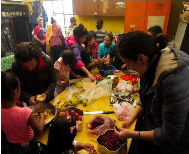
Fotografía 23. Gestar encuentros para compartir saberes. 2019.

Más allá de hacer talleres y de ser un centro de ocupación del tiempo de los niños, pretende es aportar a la construcción del ser humano, entendiéndolo que los seres humanos todos, todos tenemos un potencial muy grande para liberarnos en lo que queremos, en lo que soñamos y poder soñar juntos, entonces acá lo que pretendemos es que cada