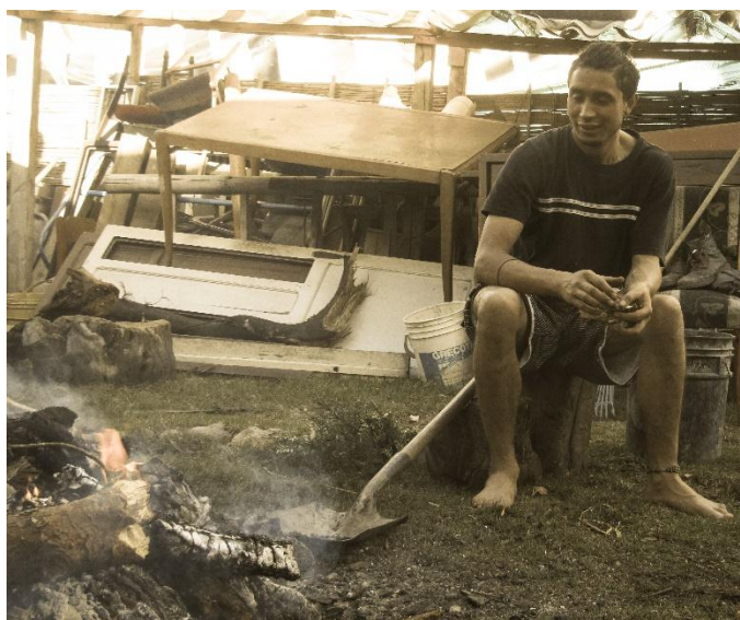
Fotografía 16" Vamos compartiendo la vida con la Tierra, encendiendo el fuego".

Desde todo este compartir, se puede reconocer como a través del entender las dinámicas familiares y sociales de las Niñas Niños y jóvenes de esta organización es posible apostar a prácticas que permitan transformar desde el corazón, pues las dinámicas sociales de los niños influyen y trascienden severamente en los procesos de aprendizaje, es así como la escuela debe replantearse las dinámicas, concibiendo y comprendiendo la emocionalidad de los sujetos, para poder gestar procesos educativos para la vida, en donde la razón no sea el único camino para aprender, sino que por el contrario se gesten relaciones de afecto y confianza para potenciar los dones de los sujetos.