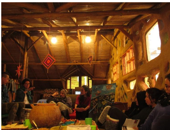
Fotografía 27Aportes y comentarios. Cendales F, 2019

“Es una perspectiva distinta de como se ve casa taller, entonces ver es muy chévere experimentar que la Biología no solo habla de los pájaros sino de también del ser como persona, del ser con los demás y de todas las relaciones que se pueden generar desde lo biológico... creo que todos acá somos maestros que todos nos enseñamos los unos a los otros, creo que es una experiencia bastante enriquecedora, conocerte además y hacernos mejores personas cada día”. (María José)