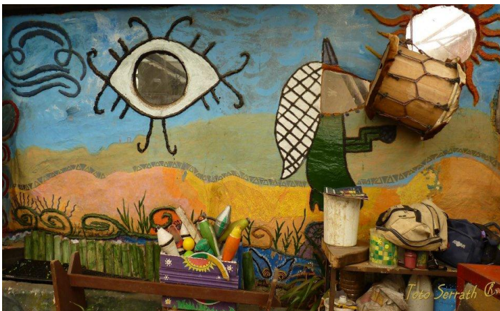
Fotografía 13 Los colores activan la imaginación. 2011

Es así como Casa Taller cuenta con espacios vivos (Huerta, granja), que potencian e incentivan el aprendizaje a partir del sentir y la experiencia, los procesos que se gestan desde los diversos espacios construidos por esta organización cautivan e incitan a explorar, conocer, aprender y des-aprender, por lo