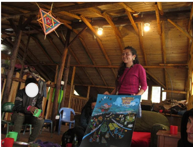
Fotografía 25 Socialización, Entretejido la vida en Casa Taller las Moyas, 2019

La socialización estuvo dividida en dos momentos, el primero con el grupo de niños de la casa, en el cual fue necesario utilizar un lenguaje que permitiera la comprensión para ellos, utilizando como herramienta vital la ilustración “Entretejido la vida en