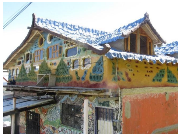
Fotografía 9 Bio-construcción Casa Taller Las Moyas. 2018