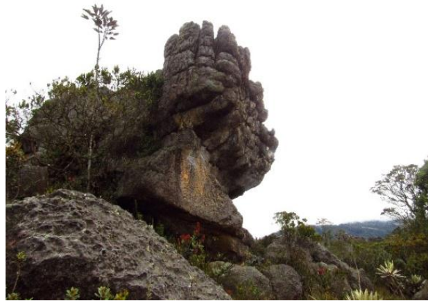
Fotografía 5 Piedras sagradas, páramo de las Moyas. Sep. 2018

Un nido de alta densidad energética, de alta pureza donde los antiguos Mhuyscas subían hacer trabajo de oración y de conexión cósmica. En este se preparaban los sacerdotes mayores y constituía un espacio de retiro, por tanto, era el lugar visitado