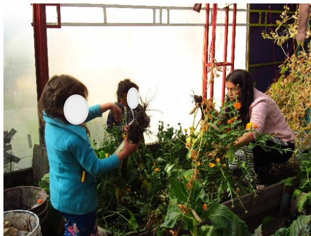
Fotografía 7 Plantas medicinales, Huerta Casa Taller Las Moyas. 2017.

Al iniciar el proceso de práctica pedagógica y en la búsqueda de un lugar alternativo y diferente a las dinámicas de la escuela tradicional , llegue a Casa Taller las Moyas sin imaginar lo que encontraría en este lugar –era una escuela soñada- , pasaban muchas cosas a la vez, habían niños jugando, algunos tejiendo, otros haciendo pan, sembrando, cocinando, todo lo que acontecía allí generaba un sin fin de