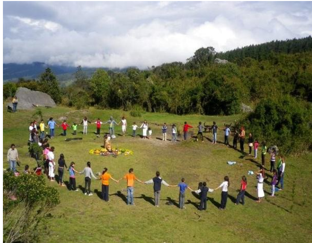
Fotografía 14 "Pagamento a la montaña". Archivo Casa Taller. 2011.

Desde entonces y semanalmente comenzamos el aprendizaje de algunas danzas (huacholo, águila blanca, danza del fuego, y del mono). Este es un aprendizaje del ritual que tiene que ver con la disposición de los danzantes respecto a la Naturaleza, el fuego, las ofrendas, el aprendizaje de cantos, los pagamentos. (Pérez, M, 2009)