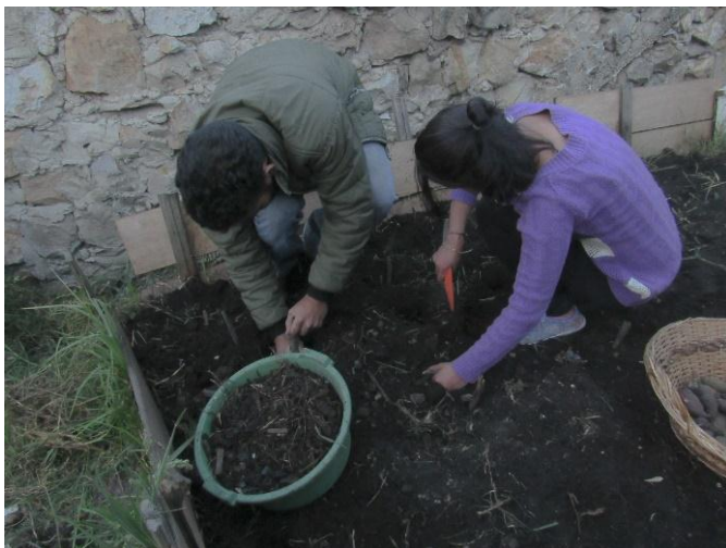
Fotografía 20 Reconectarse con la naturaleza!. Enero 2018