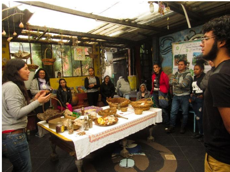
Fotografía 22Taller de semillas con estudiantes de la UPN. 2019. Archivo personal.

Al ser esta organización un Casa de puertas abiertas, se van construyendo saberes con diversas personas que llegan a vivir esta experiencia, lo que ha posibilitado un red de relaciones y encuentros con procesos que adelanta la Universidad Nacional desde el curso de huertas, con la