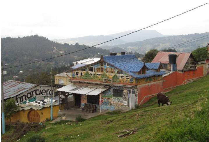
Fotografía 6 Casa Taller Las Moyas de niñas, niños y jóvenes. 2018

Es así como Casa Taller las Moyas desde el reconocimiento del territorio nace hace 14 años, muy cerca de este páramo; fue soñada y pensada como un espacio que permitiera ofrecer otras miradas de ser y hacer frente a las fuertes dinámicas sociales que se viven en el