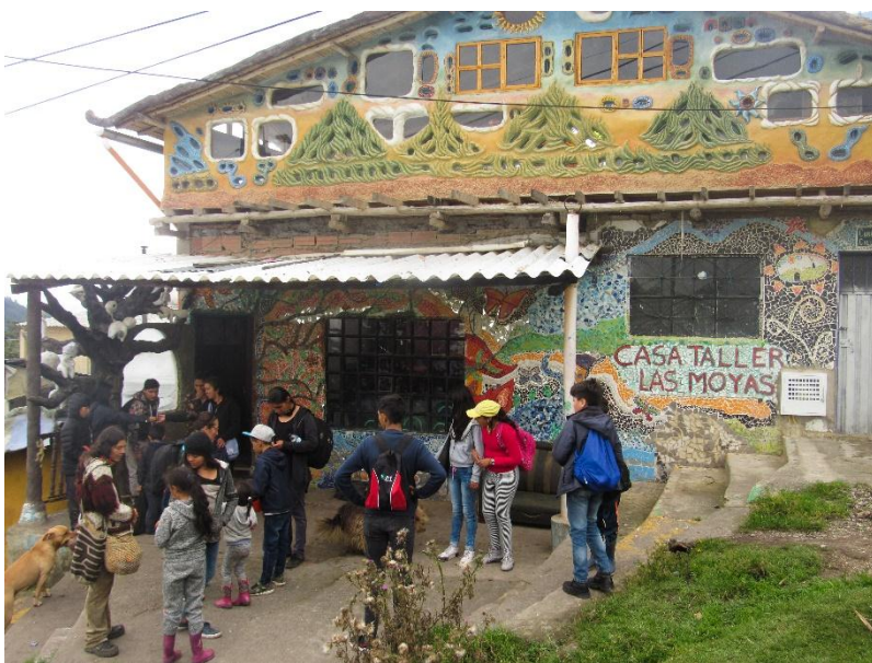
Fotografía 3 La Casa de los Sueños-Casa Taller las Moyas. Abril 15 de 2019.

mujeres y hombres del barrio, los cuales están expuestos al consumo, la violencia intrafamiliar y el abandono.