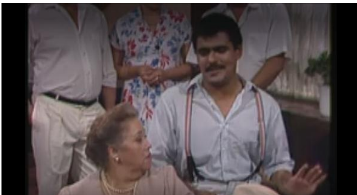
Figura 3. Un encuentro que no es adecuado [capítulo 49 de serie de televisión]. En Caracol televisión (productor). San Tropol . (1982). Colombia. Recuperado de: https://play.caracoltv.com/san-tropol/un-encuentro-que-no-es-adecuado

En este contexto el hombre cabeza de hogar a diferencia del viudo, no puede contraer un nuevo vínculo matrimonial por la iglesia porque en términos religiosos su condición de vinculación afectiva sigue vigente, puede contraer vinculación afectiva no formalizada con una mujer. Además al igual que el viudo el padre cabeza de hogar puede relegar las responsabilidades asociadas al rol materno con familiares femeninos.