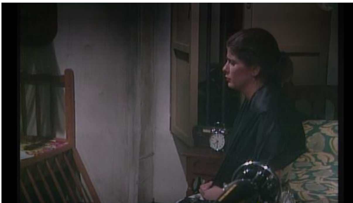
Figura 1. Un muerto de los morales [capítulo 5 de serie de televisión]. En Caracol televisión (productor). La Mala Hierba . (1982). Colombia. Recuperado de: https://play.caracoltv.com/la-mala-hierba/un-muerto-de-los-morales

El primer factor de ausencia completa de la figura paterna es por fallecimiento, generalmente vinculado con factores de salud, accidentes de distinta índole o asesinato. En La Mala Hierba que se pudo observar el asesinato de uno de los hermanos Morales dejando a su esposa como cabeza de hogar (figura 1).