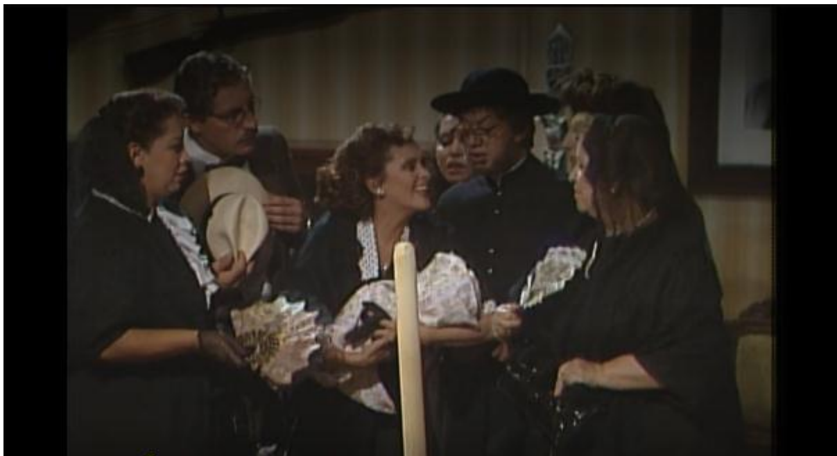
Figura 2. La muerte por la vida de un bebé [capítulo 7 de serie de televisión]. En Caracol televisión (productor). San tropel . (1982). Colombia. Recuperado de:

cuidados maternos a hermanos menores, nietos o sobrinos, las labores de aseo y preparación de alimentos entre otras.