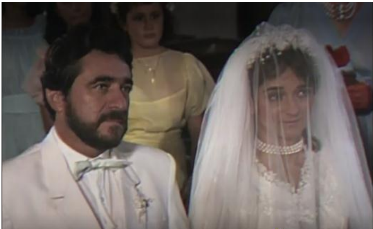
Figura 4. Orlando y Constanza se casan [capítulo 32 de serie de televisión]. En Caracol televisión (productor). San tropel . (1982). Colombia.