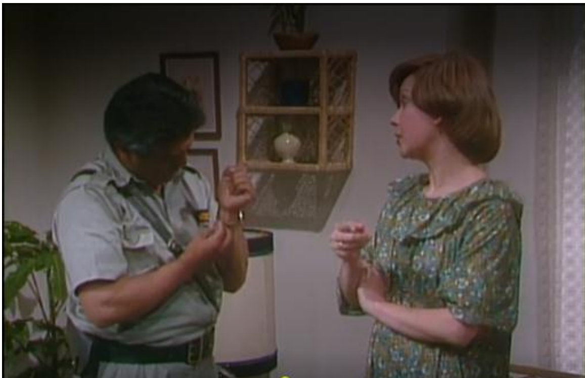
Figura 5. Una hermosa mujer llega a la vida de Roberto [capítulo 54 de serie de televisión].

En Caracol televisión (productor). La Mala Hierba . (1982). Colombia. Recuperado de: