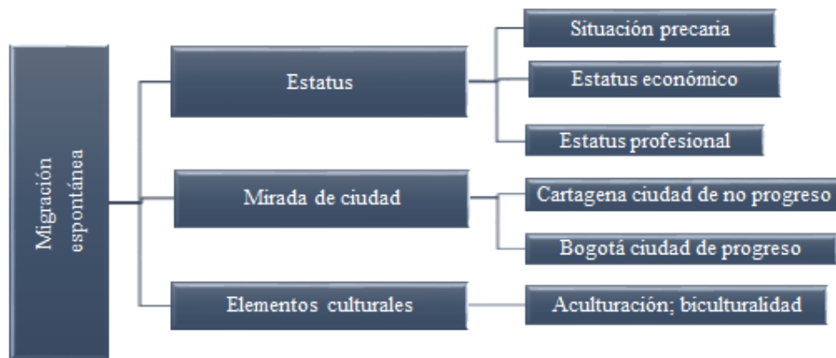
Figura 1 Categoría de Migración espontanea

En este apartado, iniciaremos mostrando las diferentes motivaciones que han aparecido en las entrevistas realizadas. A pesar de que a la hora de redactar el informe estas motivaciones las hemos agrupado por categorías, esto no quiere decir que las categorías sean excluyentes, ya que generalmente la migración no responde a una única motivación sino que es una suma de varias de ellas, La migración la hemos dividido a la luz de la teoría, en dos categorías metodológicas, migración dirigida y migración espontánea, que a su vez se subdividen en categorías de análisis. En esta sección se presentará el análisis de la migración espontánea tal como se observa en la figura 1.