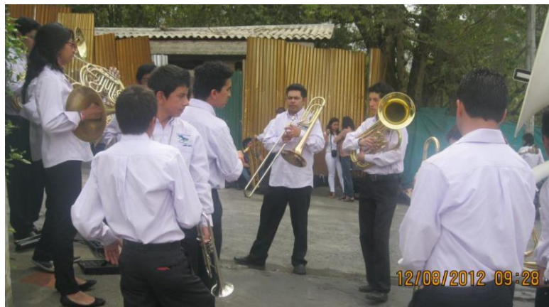
ILUSTRACIÓN 3.BANDA SINFÓNICA DE COGUA AÑO 2012