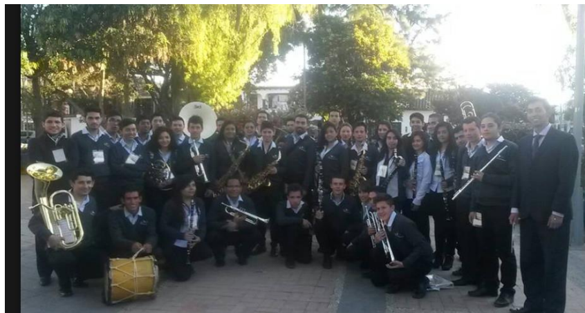
ILUSTRACIÓN 5. BANDA SINFONICA DE COGUA 2016