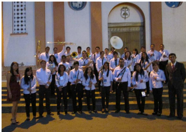
ILUSTRACIÓN 4. BANDA SINFÓNICA DE COGUA AÑO 2013