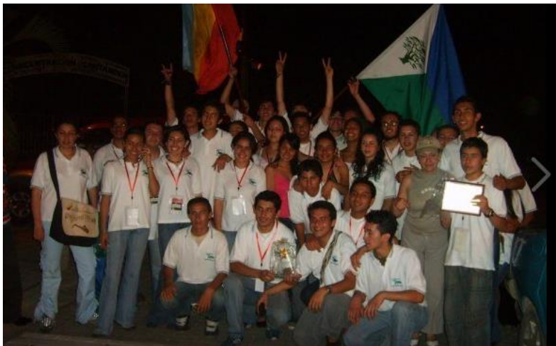
ILUSTRACIÓN 2. BANDA SINFÓNICA DE COGUA AÑO 2007