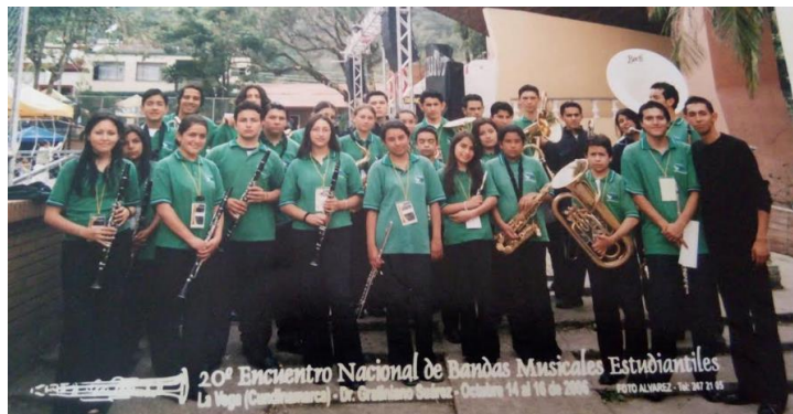
ILUSTRACIÓN 1. BANDA SINFÓNICA DE COGUA AÑO 2006