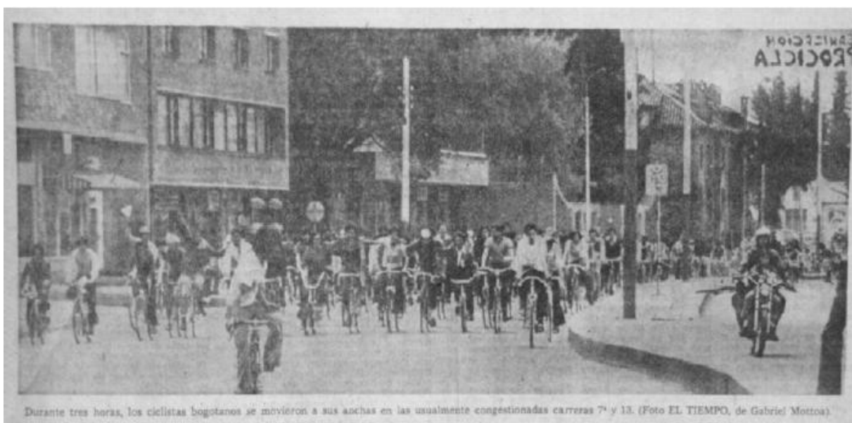
Durante tres horas, los ciclistas bogotanos se movieron a sus anchas en las usualmente congestionadas carreras 7ª y 13.

En el transcurso de los últimos años hemos tenido visitas de diferentes delegaciones gubernamentales nacionales e internacionales, que vienen a observar la experiencia del programa Ciclovía - Recreovía de Bogotá con el fin de implantar una cultura de deporte y recreación en sus respectivos países. Es por esta razón que en el año 2003 se llevó a cabo el Primer Seminario Internacional de Ciclovía, en las instalaciones del I.D.R.D. con asistencia de organizaciones como la O.M.S., Taffisa, y en el año 2005 se realizó el Seminario Internacional Ciclovías Unidas de las Américas, entre otros.