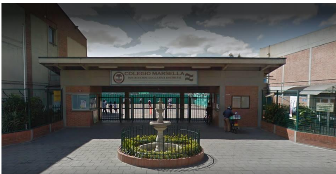
Figura 1. Colegio Marsella

El Colegio Marsella I.E.D. alberga a estudiantes de clase social estrato dos y tres, el mismo que se encuentra ubicado en una zona de clase media-alta en Bogotá- Colombia. La institución tiene un enfoque hacia la investigación y el humanismo, lo cual se refleja en su logo en donde tiene estas dos palabras como parte de su escudo.