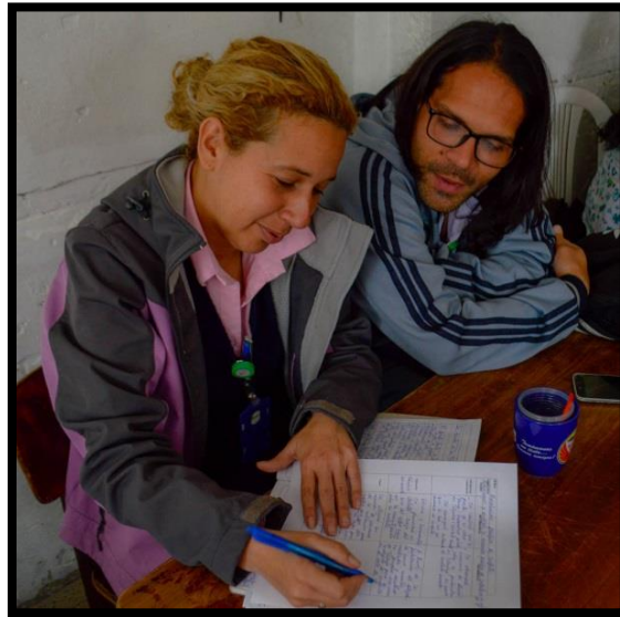
Ilustración 6 Día 2, Realización de las unidades didácticas.

tratados en las sesiones de intervención. Se determina usar el formato base de las planeaciones en este trabajo de investigación para la realización de las unidades. En la proyección de las unidades didácticas los temas que los docentes tomaron giraron en torno a la sensibilización de la convivencia, el reconocimiento del otro, el hombre y su relación con la tierra, la deshumanización los seres humanos como objetos y el trabajo cooperativo.