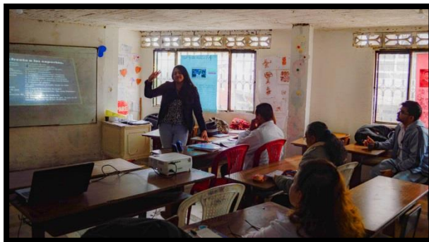
Ilustración 8 Intervención en el colegio Van Leeuwenhoek.

Desde el trabajo realizado en la intervención, con una institución de carácter privado, podemos sugerir algunos puntos a tener en cuenta al desempeñar una labor como la de capacitar a los docentes en práctica, estarán encaminados hacia todos aquellos que deseen abordar el tema del trabajo directamente enfocado a trabajar con docentes en educación para la paz. No solo de forma teórica, sino de forma práctica pues es allí donde se presentan los principales problemas para lograrlo de forma exitosa.