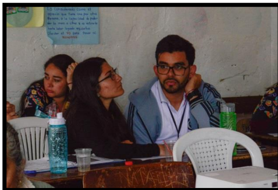
Ilustración 9 Sesión de Trabajo Cooperativo.

En el momento de realizar la instrucción en una institución de cualquier tipo, se sugiere hacerlo en un primer momento, al iniciar las actividades académicas del año académico pues al iniciar el calendario escolar los maestros de las instituciones están en una actitud desprevenida y sin las cargas laborales implantadas por su trabajo diario. La actividad planteada en este proyecto fue realizada antes de tomar su receso de mitad de año, lo cual dificultó la disposición de los espacios dentro de las ocupaciones del maestro en esta época, también se presentaron inconvenientes para llegar a acuerdos con la institución sobre el tiempo empleado para la capacitación, así mismo los maestros no estaban con la mejor disposición para la actividad.