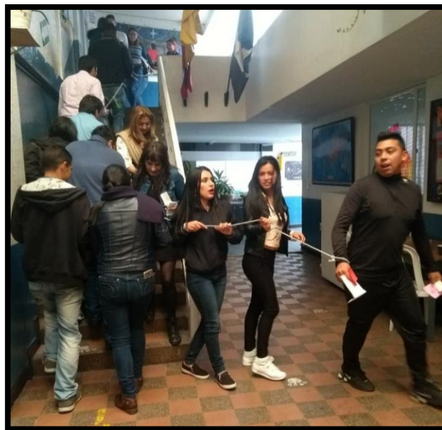
Ilustración 1 Capacitación docente sobre la buena enseñanza (CIEN)

Esta capacitación tuvo en los docentes una reflexión mayor sobre sus prácticas educativas, fue enfocada en subir los estándares educativos en la institución, aunque fue enfocada en la calidad educativa desde el punto de vista de los resultados académicos, en esta capacitación se dieron diferentes formas de interactuar entre los docentes que dieron como resultado la transformación de las formas de relacionarse entre ellos en los días siguientes, lo cual cambio radicalmente, los maestros que nunca tenían contacto empezaron a saludarse en el inicio de la jornada laboral y los trabajos en grupo fueron mucho más fluidos.