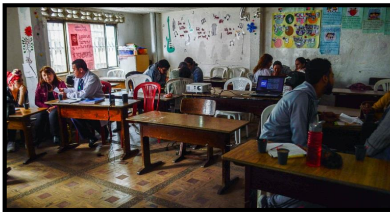
Ilustración 2 Capacitación docente día 1.