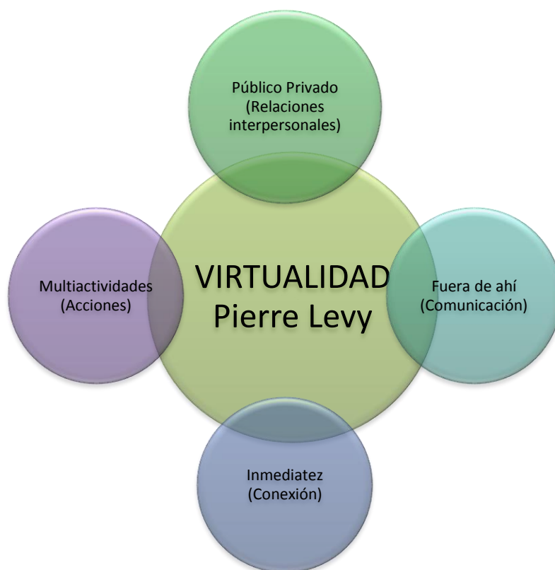
Figura N°1. Categorías deductivas y término- motivo descriptor desde la perspectiva de la virtualidad (Autoría propia).