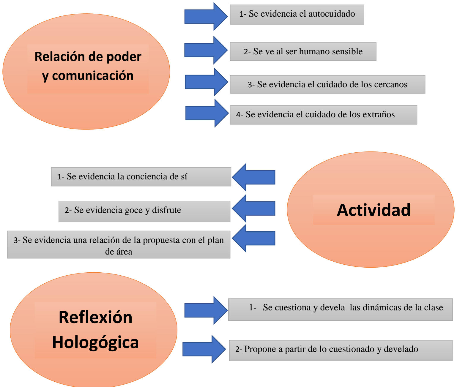
Figura 2 Matriz de evaluación