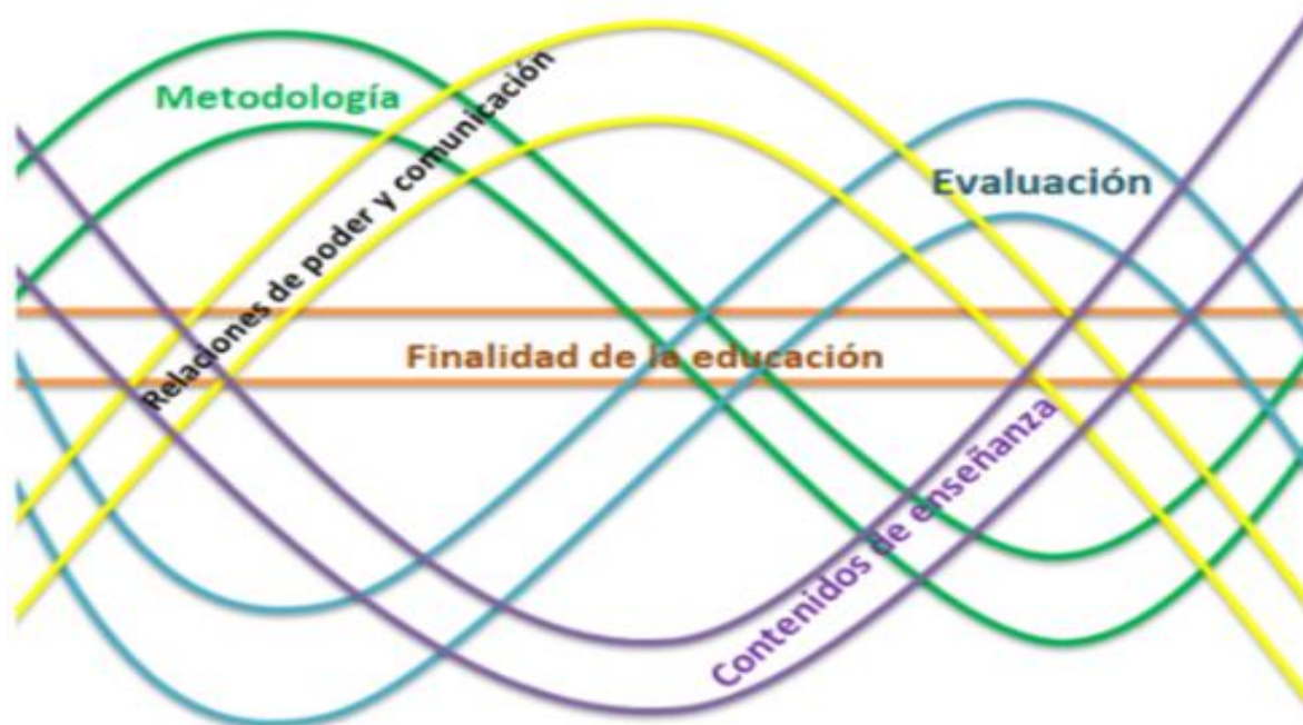
Figura 1 Elementos estructurales de la propuesta curricular

Finalidad de la educación: correspondiente al mismo propósito de formación anteriormente mencionado y razón por la cual es transversal a los otros elementos.