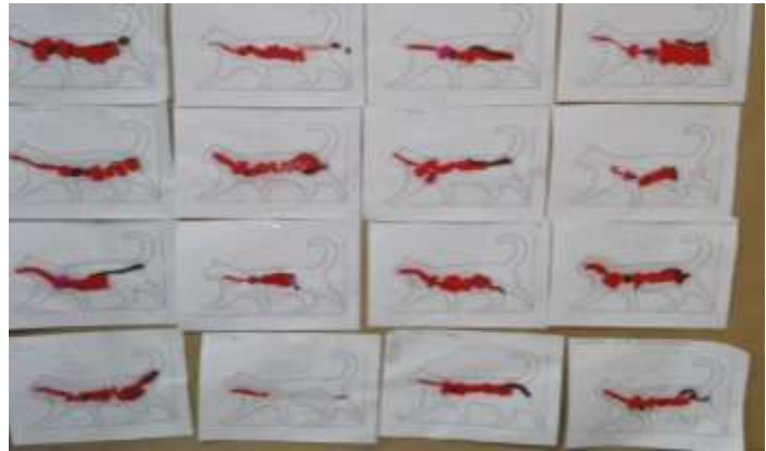
Tópico ¿Todos los gatos son iguales?