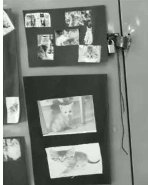
Tópico ¿Por qué los gatos tienen bigotes?