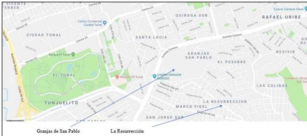
Figura 1. Localización del barrio Granjas de San Pablo